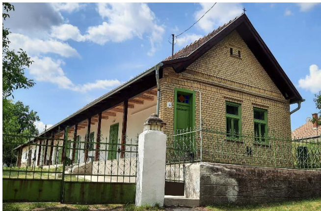
Az elkészült Értékek Háza

Július 15-én a Falunapon került átadásra és megáldásra az Értékek Háza Palotáson.