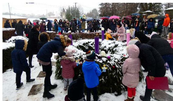
A második adventi gyertya meggyújtása

December 16-án kerül sor a harmadik adventi gyertya meggyújtására a Kenderike Néptáncsoport és a Palotás Ifjúságáért Alapítvány tagjainak közreműködésével. Ezen a napon (december 16.) lesz karácsonyváró ünnepségünk, a Falukarácsony a Művelődési házban. Halászlével, kaláccsal, kakaóval, forralt borral kínáljuk vendégeinket!