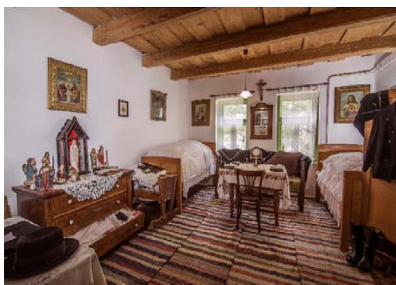
Értékek Háza első szobája

Egy letűnt világ emlékei az itt bemutatott berendezési, és használati tárgyak. Persze vannak hasonló gyűjtemények a környék településein is. Most már van nekünk is, ami egyedi, ami elődeink életéről mesél, amit a mi nagyszüleink, dédszüleink hagytak ránk.