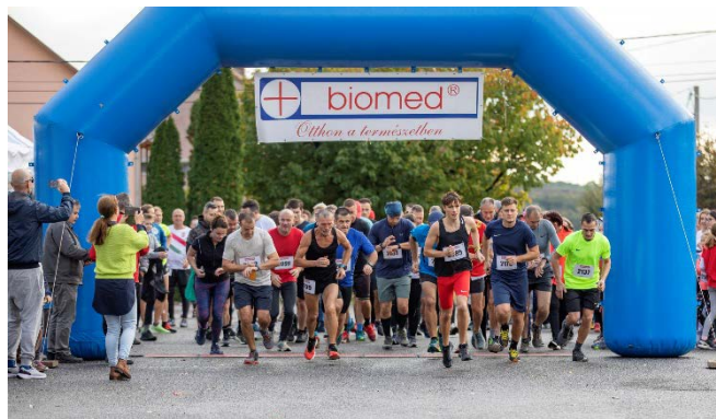
Rajtolnak a hosszútáv versenyzői