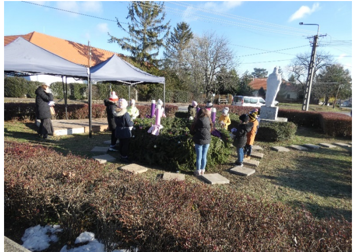
Elsőáldozók az adventi koszorú körül

December 5-én a Magyar Vöröskereszt Nógrád Vármegyei szervezete véradást szervezett a településen, melyhez a helyszínt a művelődési ház biztosította.