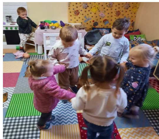
Bölcsisek készülődése az ünnepekre

Aki fázik, vacogjon, fújja a körmét, topogjon, földig érő kucsmába, burkolózzék bundába, bújjon be a dunyhába, üljön rá a kályhára - mindjárt megmelegsik."