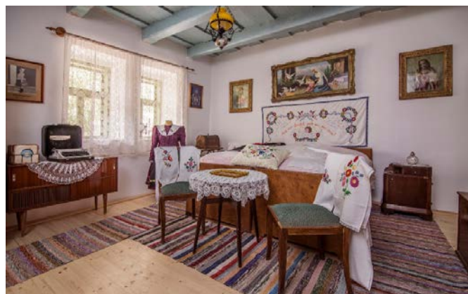
Az Értékek Háza berendezett hátsó szobája

Rajtam kívül sokan úgy gondolják, hogy meg kell őrizni, becsülni, és a fiataloknak is be kell mutatni hogyan éltek elődeink. Az átadás óta is nagyon sok mindent hoztak a látogatók.