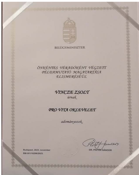
Pro Vita oklevél