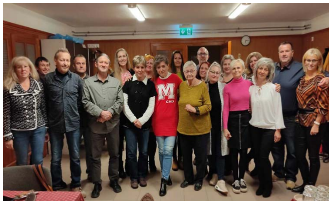
Palotási Általános Iskola 1988-ban végzett osztálya

2023. november 4-én tartottuk a 35 éves osztálytalálkozókat. Sajnos az iskolába nem mehettünk így azt sokan csak kívülről nézhették meg milyen változásokon esett át ez idő alatt.