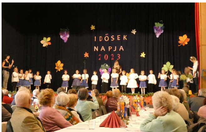
Az óvodások köszöntő műsora