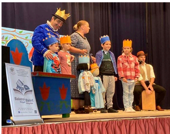
Békakirálykisasszony előadás a művelődési házban

Szeptember 29-én megtartottuk a magyar népmese napját. A Magyar népmesék rajzfilmsorozat 3 meséjét néztük meg a gyerekekkel. Október 13-án a Művelődési Ház jóvoltából a Békakirálykisasszony című előadást láttuk a Paramisi Társulat előadásában.