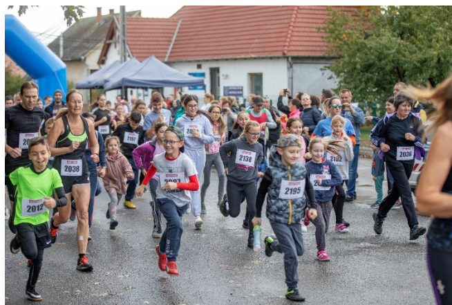
Rajtolnak a rövidtáv versenyzői

A Palotási Gyermeklanc Óvoda Főzőkonyhája dolgozói palóc gulyást készítettek, melyet megérdemelten fogyaszthattak el a verseny résztvevői.