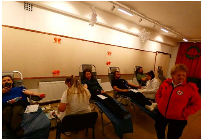
Véradás a művelődési házban

December 5-én a Magyar Vöröskereszt Nógrád Vármegyei szervezete véradást szervezett a településen, melyhez a helyszínt a művelődési ház biztosította.