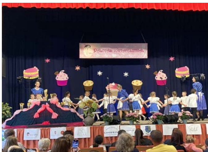
Óvodások műsora a Tortafesztiválon

A nagycsoportos gyerekek színvonalas műsorral szerepeltek az október 7-én megrendezett Tortafesztiválon és 18-án az Idősek Napja alkalmából szervezett ünnepségen.