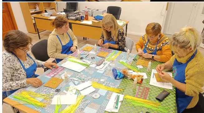
A szakkörök résztvevői

November 10-én a Nógrád Táncegyüttes „Ott-Hon” című műsorát tekintették meg a palotási általános iskolások a művelődési házban. A műsor a Kárpát-medencei magyarság különböző népcsoportjainak tánckultúráját vonultatta fel, a népcsoportokhoz kapcsolódó különböző néprajzi ismeretterjesztéssel.