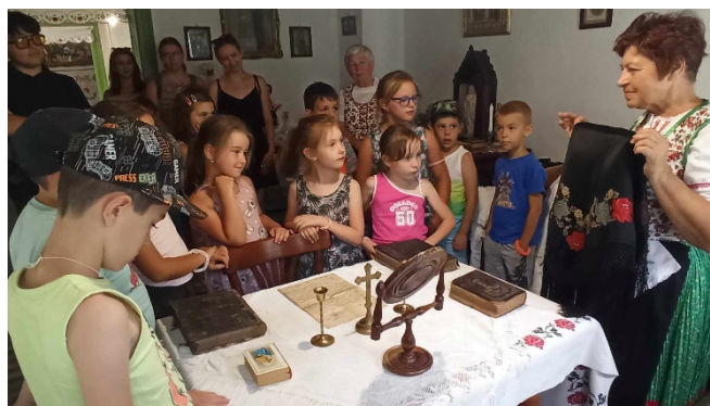
A gyerekek érdeklődéssel hallgatták a bemutatót