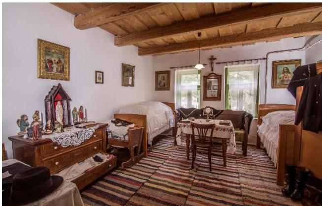
Értékek Háza első szobája