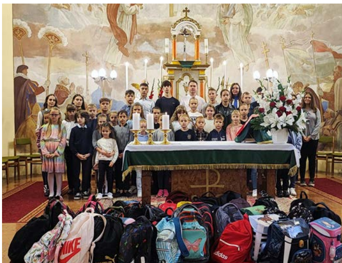
Csoportkép a tanévnyitó szentmise után