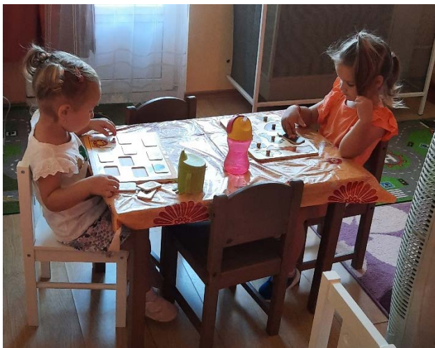
Bölcsisek játék közben

"Október, ber, ber, ber, fázik benne az ember. Szőlőt csipked a dere, édes legyen szüretre."