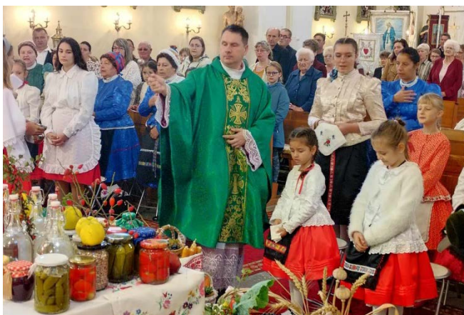
Terménybetakarítási hálaadás a templomban