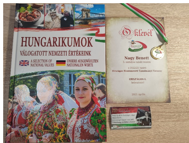
Az elnyert díjak