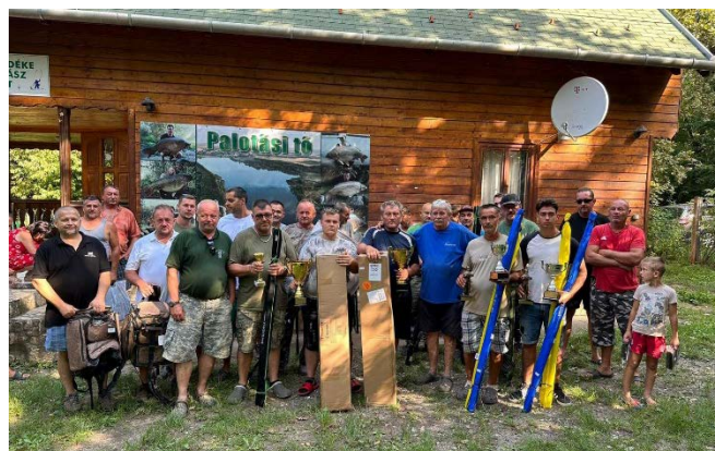
A Harcsafogó verseny résztvevői

A harcsafogó verseny az idei évben is augusztus végén zajlott le, melyen elsősorban tagok vettek részt. A halfogás sajnos messze elmaradt a múlt évitől, hiszen akkor 431 kg hal került horogra, az idén csak 63,50 kg. Az időjárás nem kedvezett a horgászoknak, sem a halaknak. A nagy melegen kívül a sok szúnyog is megkeserítette a versenyzők napjait. A versenyen 40 csapat /80 fő/ indult. Az ötnapos horgászat a meleg ellenére, nagyon jó hangulatban, családi légkörben zajlott. Baráti beszélgetések, bográcsozások tették teljessé. Az első 10 helyezett értékes tárgyjutalomban részesült. Külön díjat kapott ezenkívül a legnagyobb és a legkisebb halat fogó csapat is.