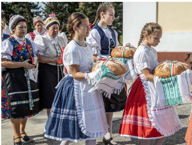
Megszentelni viszik az új kenyeret

kenyeret, majd polgármester úr és jegyző asszony koszorút helyezett el a Szent István szobornál.