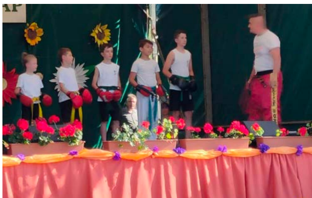
A Palotási Kickbox Csoport bemutatkozása a Falunapon