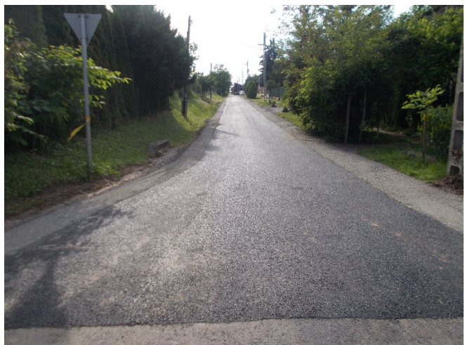
Az elkészült Diófa út az Ady út felől