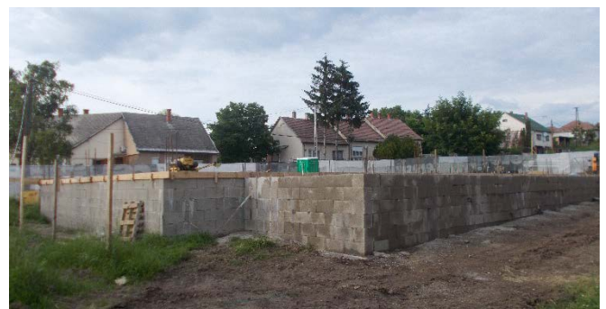
Bölcsőde alapozása és a lábazati fala már elkészült

Palotás Község Önkormányzata Képviselő-testülete a Terület- és Településfejlesztési Operatív Program keretén belül támogatott „Bölcsőde építése Palotás községben” című, TOP-1.4.1-19-NG1-2019-00007 azonosító számú projekt megvalósításához kapcsolódóan a 3042 Palotás, Kossuth utca 2., 8 hrsz. alatti ingatlanon megvalósítandó bölcsőde építéséhez a közbeszerzési eljárás lefolytatását követően bruttó 50.722.114 Ft többlettámogatási kérelmet nyújtott be, amely pozitív elbírálást nyert, így a projekt teljes költsége bruttó 333.180.859 Ft-ra emelkedett. A munkaterület átadása 2023. március 31-én megtörtént a nyílt közbeszerzési eljárásban nyertes ajánlattevő, Keli-Bau Kft részére, amely a kivitelezést haladéktalanul meg is kezdte.