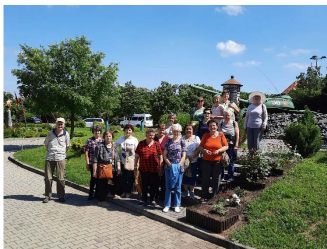
Pákozdon a nyugdíjas klub tagjai

Júniusban tartottuk a Férfinapot, amelyen a másik nem képviselőit köszöntjük.