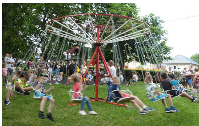
Repül a körhinta