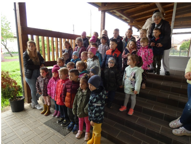
Óvodások a Vidra Verdánál

kon vehettek részt az óvodások és a Palotási Általános Iskola 3-4. osztályos tanulói az óvoda udvarán. A gyerekek nagyon aktívak és érdeklődők voltak.