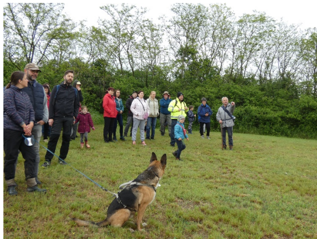
A túrázók egy csoportja az „Ebháton”