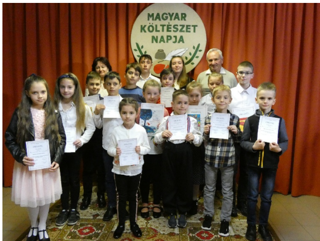
A szavalóverseny résztvevői

Szeretettel gratulálunk nekik és minden résztvevőnek kiváló színvonalú, értékes előadásukért! Köszönet a zsűrinek és az előadóknak!