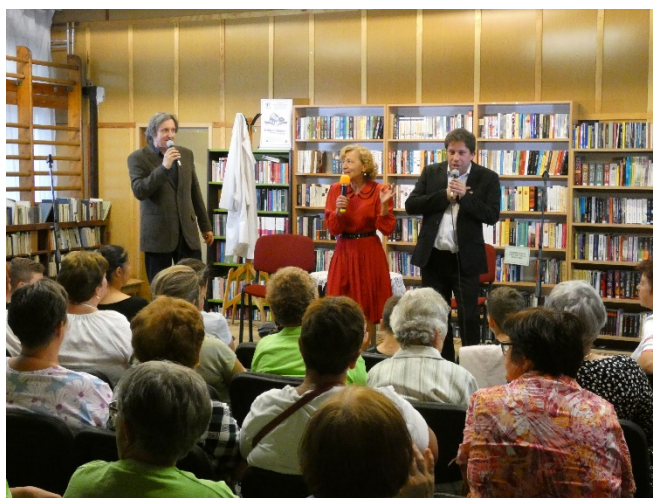
Zenés kabaré előadás

Június 14-én Nevető XX. század címmel zenés kabaré előadást tekinthettek meg az érdeklődők a Szabad Ötletek Színháza társulat előadásában. A kellemes, vidám nyáresti kikapcsolódást nyújtó programot a Balassi Bálint Könyvtár biztosította.