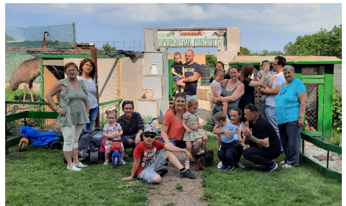
Bölcsiseink és kísérőik a Frenklin Parkban