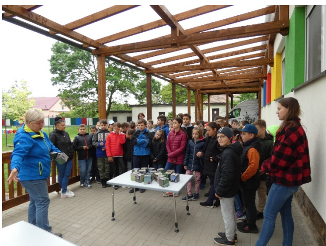
Iskolások a Vidra Verdánál

Május 27-én a gyermeknap rendezvényt a Palotás Ifjúságért Alapítvány tagjaival közösen szerveztük és valósítottuk meg. Gyermekszivajgtól volt hangos a Szabadság úti park, ahol különféle programokkal találkozhattak a kilátogatók: népi fajátékok, társasjátékok, ügyességi feladatok, csillámtetoválás, hajfonás, lovagoltatás, traktorozás és meseelőadás szerepeltek a kínálatban. Köszönjük minden segítőknek, közreműködőknek a megvalósításban való részvételt! A gyermeknap rendezvény keretében mutattuk be a Nemzeti Művelődési Intézet támogatásával, A Szakkör program keretében megvalósuló helyi közösségekben készült alkotásokat. Palotáson négy szakkör is indult, a résztvevők a papírfonás, a makramézás, a gyöngyfüzés és a bútorfestés technikáját sajátíthatták el. A január óta rendszeresen megtartott összejöveteleken gyönyörű