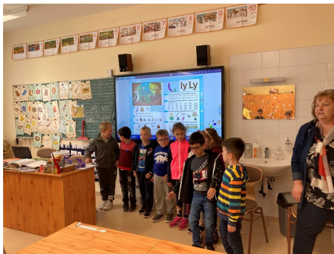
A leendő elsősök az iskolában