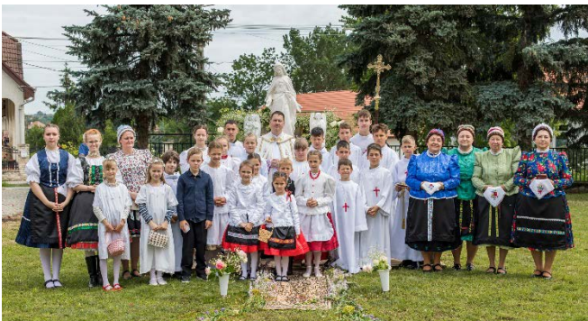
Csoportkép az úrnapi mise után