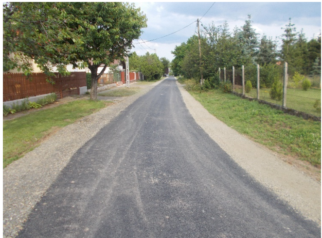
Az elkészült Diófa út a Sugár út felől

Palotás Község Önkormányzata által a Belterületi közutak fejlesztése című felhívásra benyújtott TOP PLUSZ-1.2.3-21-NG1-2022-00041 azonosítószámú pályázata a Diófa út felújítására bruttó 47.345.260 Ft támogatást nyert. Az útfelújítási munkálatok elvégzésére a beszerzési eljárás lefolytatásra került, a legkedvezőbb ajánlati ár bírálati szempont szerint a Perial-Ker Kft. (2660 Balassagyarmat, Zichy u. 5.) bruttó 41.893.475 Ft összeggel lett a nyertes. Az útfelújítási munkálatokat a kivitelező meg is valósította. A műszaki átadásra 2023. június 20-án került sor.