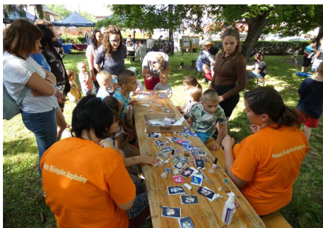
Csillámtetoválást készítenek az Alapítvány tagjai