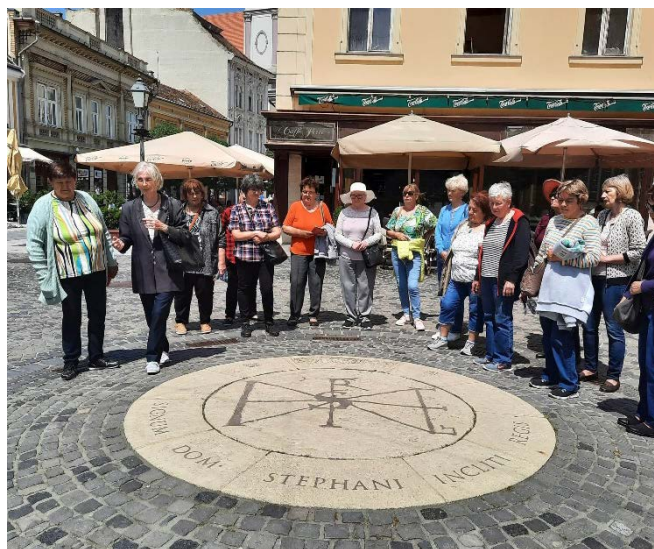
Székesfehérváron a nyugdíjas klub tagjai

Májusra kirándulást szerveztünk, Székesfehérváron a Bory várba látogattunk el, utána az idegenvezető megmutatta a belváros nevezetességeit. Székesfehérvár után Pákozdra mentünk, hogy láthassuk a Katonai Emlékparkot. Rajtunk kívül nagyon sok diák volt a bemutatóteremben. Ajánlom ezt a helyet az iskolásoknak, látványos, és ismeretgazdagító program az emlékpark bejárása. Ugyan ezt mondhatnám el a kirándulás további helyszínéről, Dinnyésről is. Pákozdon még el kell menni Miska huszárhoz is. Aki ott jár, ki ne hagyja, mert csodás. Hosszú program volt, de sok élménnyel gazdagabban tértünk haza.