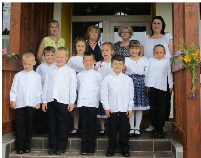
A ballagó óvodások az óvó nénikkel és a dadus nénivel

A gyereknap alkalmából a gyerekeknek udvari játékos feladatokat szerveztünk és meglepetésként egy kis ajándékot is kaptak, amit a kollégák készítettek.