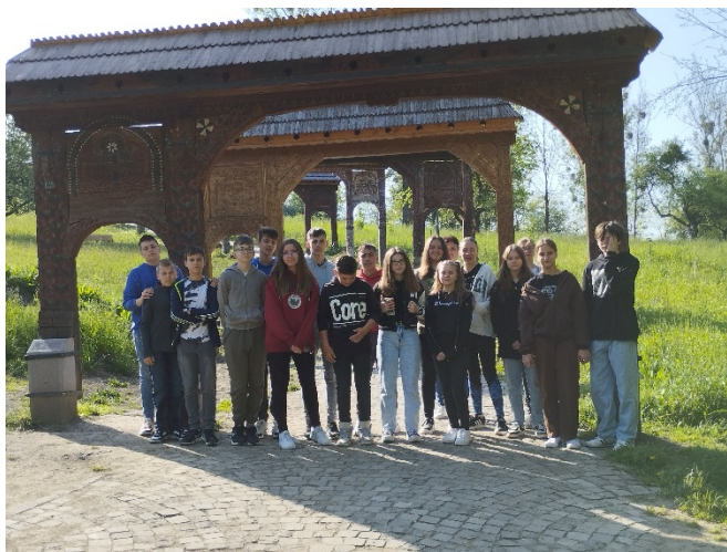
A hetedik osztályosok Erdélyben jártak

A Palotási Általános Iskola is örült a tavasz jövetelének. Március 15-ét azzal ünnepeltük, hogy a hatodik osztály játszóházat szervezett az 1848-as forradalom és szabadságharc emlékére. Március hónapban a nyolcadikosok számára lezajlottak a szóbeli felvételik és innentől csak izgatottan várták az eredményeket. Petőfi Sándor 200 évvel ezelőtti születésére emlékezve, az ő tiszteletére a tavaszi rajzverseny témája verseinek illusztrációja volt. Illetve a Művelődési Ház szervezésében egy kiállítóbuszban tekinthettük meg a költőóriás életútját és műveit feldolgozó bemutatót. Április végére a nyolcadikosok megkapták a végleges felvételeket, ahol nagy részben jó eredmények születtek. Az iskola Diákönkormányzata rendezett egy tavaszi papírgyűjtést, amelynek győztesei a negyedik, az ötödik és a harmadik osztályok lettek, akik egy-egy szabadnapot is kaptak ezért. A 7. osztály a Határtalanul! pályázatnak köszönhetően 4 napot Erdélyben tölthetett, majd hazaérkezésük után, a nemzeti összetartozás és trianoni békediktátum emlékére tartottak bemutatót az utazásukról a felsősöknek.