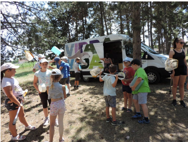
Vízmintavételre indulunk a palotási tóhoz