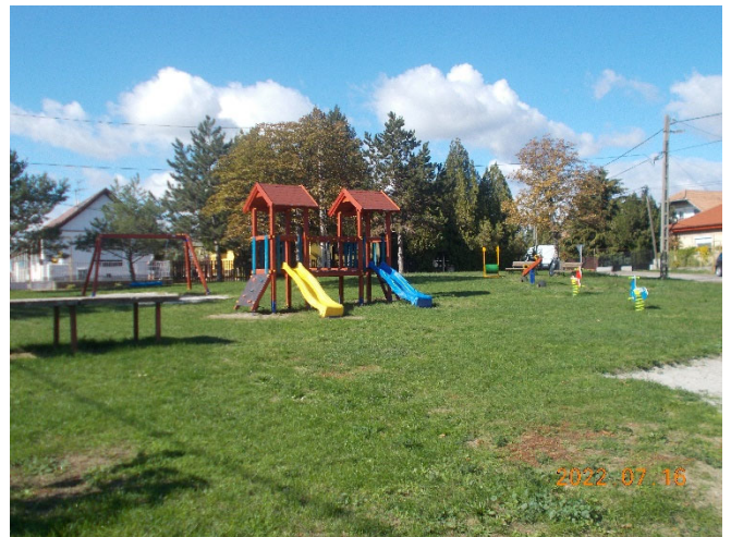
A megújult Nefelejcs úti játszótér

A Magyar Falu Program keretében támogatói döntéssel rendelkező MFP-OJKJF/2021 kódszámú, Óvodai játszóudvar és közterületi játszótér fejlesztése című a 3042 Palotás belterület 164. hrsz. alatti ingatlanon a kivitelezési tervdokumentáció szerinti játszótéri eszközök beszerzését és telepítését elvégezte 2022 júliusában a nyertes ajánlattevő, Terra-Forte Bau Kft (3662 Ózd, Somsályfő telep 1.). A Nefelejcs úti játszótéren 2 db rugós játék, mókuserék, kéttornyú játszóvár, fészekhinta, mérlegkhinta került telepítésre.