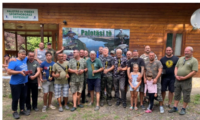
A harcsafogó verseny díjazottjai

Vigyázzunk közösen a tó és környékének tisztaságára!