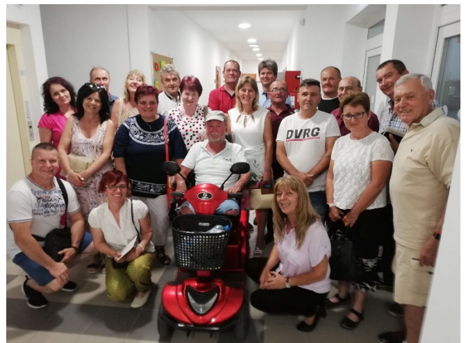
40 év után találkozott az 1982-ben végzett 8. b osztály