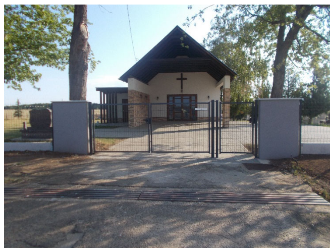
A felújított temetőkapu

Sikeres pályázatnak köszönhetően befejeződött a temetői kerítés felújítása. A Magyar Falu program keretében az önkormányzati temetők infrastrukturális fejlesztése projekt keretében az utcai oldalon elkészült a kerítés és a bejárati kapuk is.