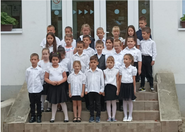
Másodikosaink az évnnyitó ünnepségen

Hosszú időszakot lezárva, újra a régi kerékvágásba térve indíthattuk el iskolánk 75. jubileumi tanévét. Az évnnyitó ünnepségen a másodikosok kedveskedtek egy rövid műsorral iskolatársaiknak.