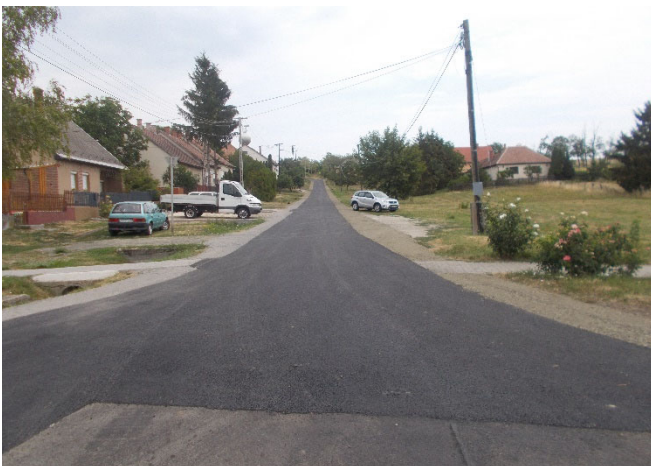
A felújított útszakasz

A Magyar Falu Program Út, híd, kerékpárforgalmi létesítmény, vízelvezető rendszer építése/felújítása - 2022 című, MFP-UHK/2022 kódszámú nyertes pályázat keretében az Önkormányzat a Palotás, Rózsa utca (Palotás 638. hrsz.) felújítására a nyertes ajánlattevőt kiválasztotta, amely a Perial-Ker Kft (2660 Balassagyarmat, Zichy u. 5.), amely a megkötött kivitelezési szerződés szerint az útszakasz felújítását elvégezte.