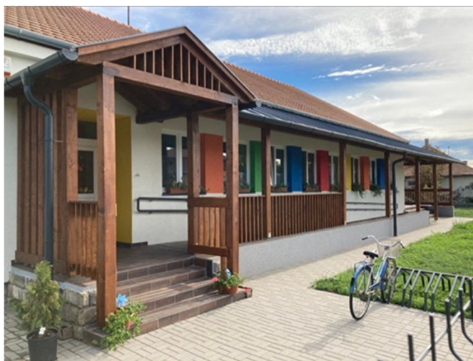
A megújult óvoda

Szeptember elején megkezdjük a 2022/2023. nevelési évet és bízom benne, hogy kicsit könnyebb évnek nézünk elébe.