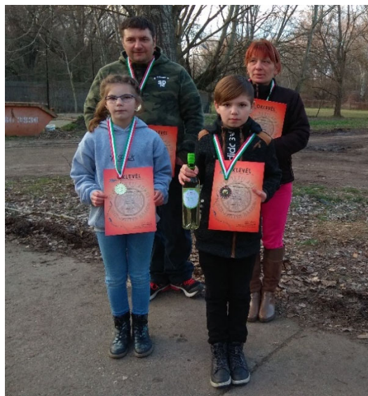
Az íjász Molnár család

Nemcsak a sport, a versenyzés, az erdő és természetjárás, a friss levegő, a mozgás, hanem az is örömet okoz számunkra, hogy itt is együtt van a család, s ez mind nagyon fontos a mai világban.