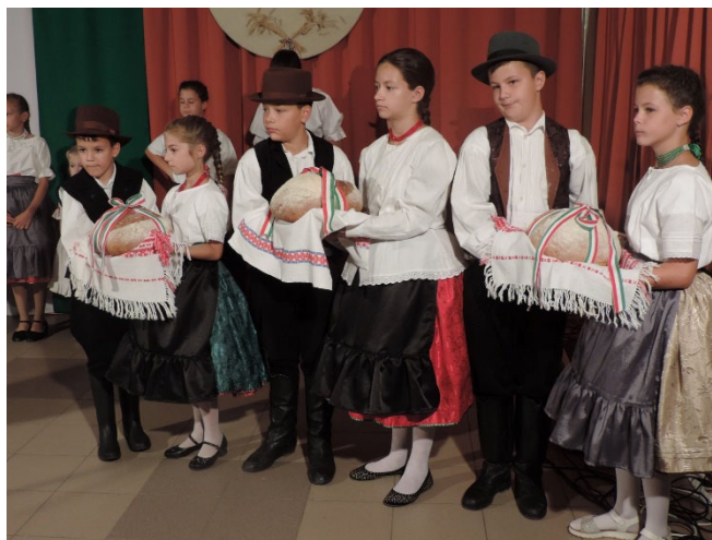
Az idei új kenyér