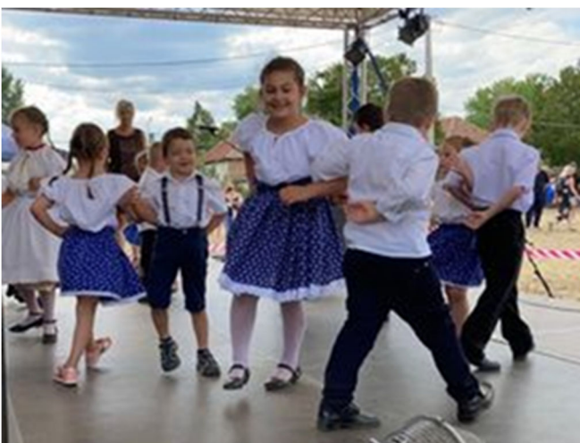
Fellépés a Falunapon

A júliusi Falunapon a gyerekek ismét felléptek. Köszönöm a szülőknek és a gyerekeknek a közreműködésüket.