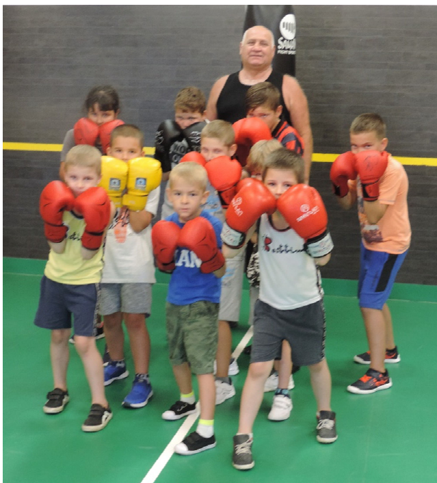
A második turnus résztvevői edzőjükkel

Nyáron két sikeres táborban vettek részt a gyerekek, ahol az ökölvívás gyakorlása mellett játékos koordinációs és kondicionáló feladatokkal ismerkedhettek meg. Videózás alkalmával pedig, híres magyar és külföldi ökölvívókat ismerhettek meg és figyelhették meg magasszintű tudásukat. A két táborban összesen 20 gyermek vett részt.