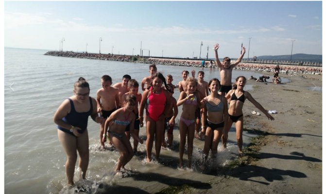
A negyedikesek a magyar tenger partján

Rá egy hétre, a hatodik és hetedik osztályosok is ugyanezen a programon vehettek részt, Így a nyárutón a fél iskola eljuthatott a Balaton partjára.