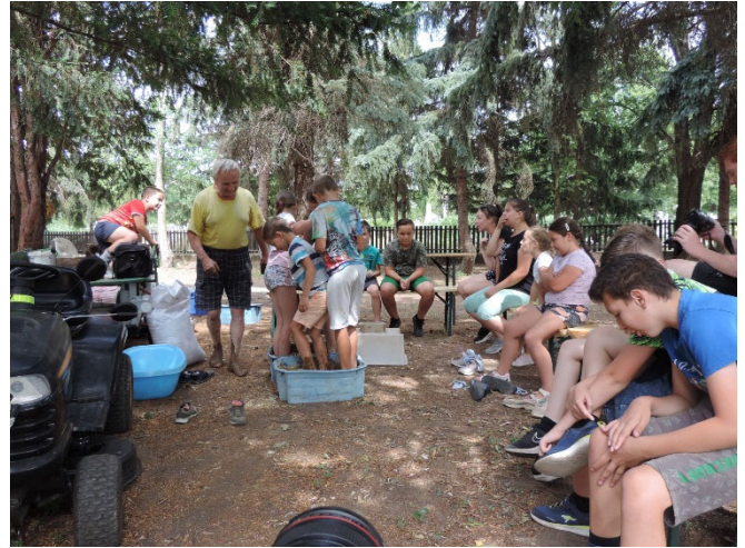
Vályogtéglát készítettek a táborozó gyerekek

délután pedig megismerkedtünk a könyvtárral és a parkban számháborúztunk.