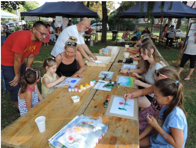
Művészeti játszótér a Park-terasz rendezvényen

A rendezvényt a Palotási Polgárőr Egyesület biztosította. A programok megkoronázásaként a Cimbaliband Zenekar Szabadon című koncertjét hallgathatták meg a jelenlévők. Köszönetet mondunk mindenkinek, aki valamilyen módon részese volt ennek a programnak, ami a szívünk csücske volt.