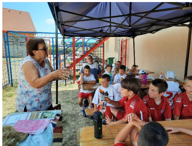
Helyi hagyományokkal is ismerkedtek a gyerekek