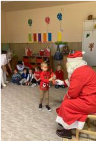
Télapó látogatása az óvodába

Decemberben ellátogatott hozzánk a télapó, majd Luca napján búzát ültettünk a gyerekekkel. Karácsony hetében a Réparetekmogyoró együttese interaktív koncertjére énekeltünk és buliztunk, majd ezt követően a karácsonyi ünnepséget is megtartottuk.