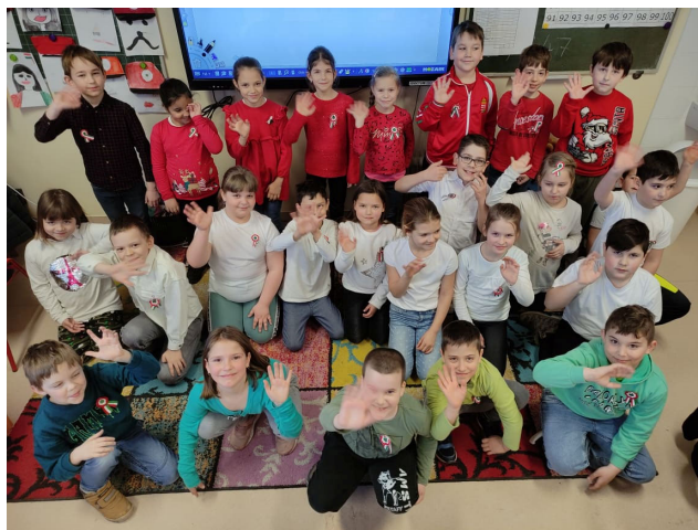
Másodikosaink a játszóház egyik feladatánál

Március 15-i ünnepen történelmi játszóházzal ünnepeltük meg a forradalom és szabadságharc ünnepét, amit a hatodik osztály szervezett.