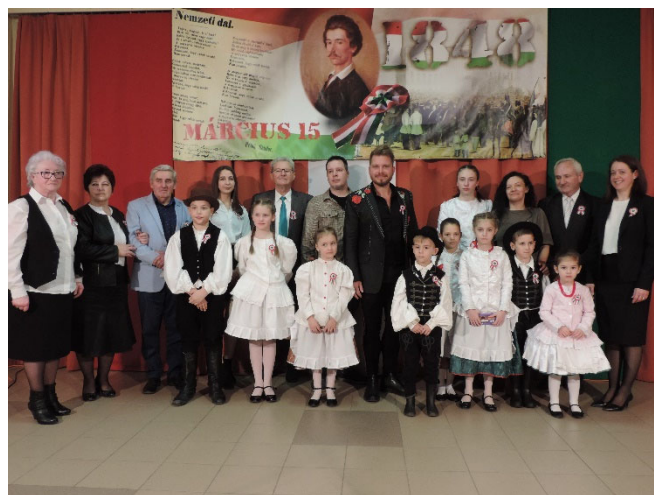
Az ünnepi műsor előadóinak egy része

Az 1848-49-es forradalom és szabadságharc 174. évfordulója alkalmából március 15-én tartottuk meg a községi ünnepi megemlékezést.