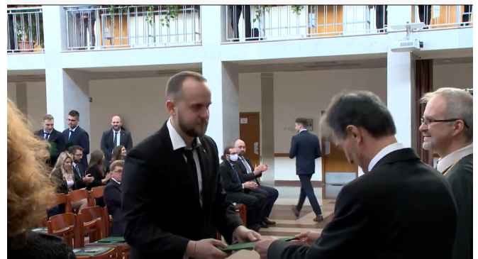
A diploma átvétele

Gazdálkodási mérnökként megfelelő természetudományi, műszaki tudományi, gazdálkodási és szervezéstudományi ismeretekkel rendelkezem a termékek és szolgáltatások anyagi, informatikai, pénzügyi és humán folyamatai integrált megoldásához. A mostani időszakban álláskeresővel foglalkozom. Végzettségemmel szeretnék Palotás környékén elhelyezkedni. Rövid és hosszú távú céljaim közé tartozik, a szakmai tudás gyakorlati elsajátítása, mint pályakezdő.