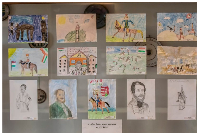
A rajzverseny zsűri által kiválasztott alkotásai