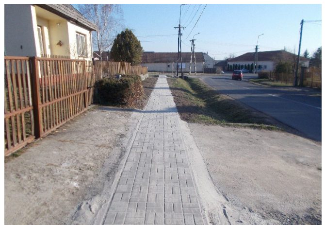
A Szabadság úti járda egyik felújított szakasza

Palotás Község Önkormányzata Képviselő-testülete a Magyar Falu Program Önkormányzati járdaépítés, felújítás anyagtámogatása – 2021 című, MFP-BJA/2021 kódszámú nyertes pályázat keretében a Palotás belterület 606/4. hrsz. alatti járda anyagköltségére nyert 5.000.000 Ft támogatásból a Szabadság úti járda felújítása folyamatban van, amelynek folytatását az Önkormányzat Palotás belterület 606/4., 610/2., 606/1. hrsz. alatti járda felújítását bruttó 4 617 879 Ft összegben saját erőből biztosítja.