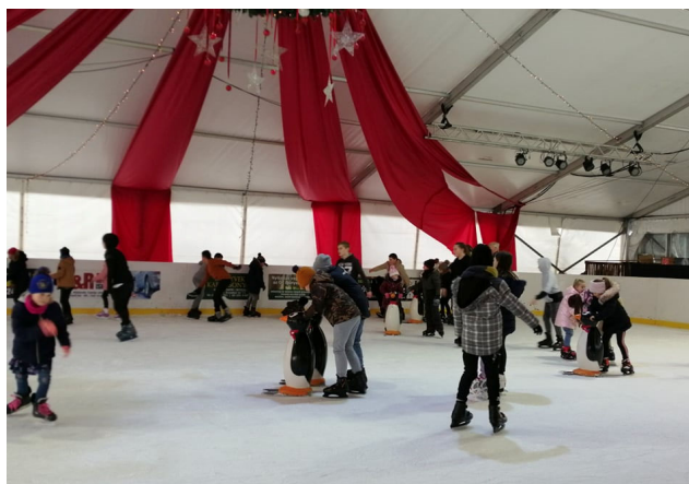
A palotási gyerekek a hatvani jégpályán

Továbbra is arra kérünk mindenkit, csak egészséges gyermeket küldjön az iskolába. Aki több információval szeretne rendelkezni az intézményben folyó munkáról, a gyerekekről, látogassa meg facebook oldalunkat, vagy keresse fel a www.palotassuli.hu internetes címet.