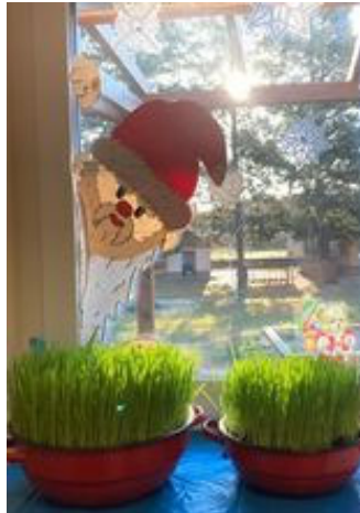
Luca búzát ültettünk