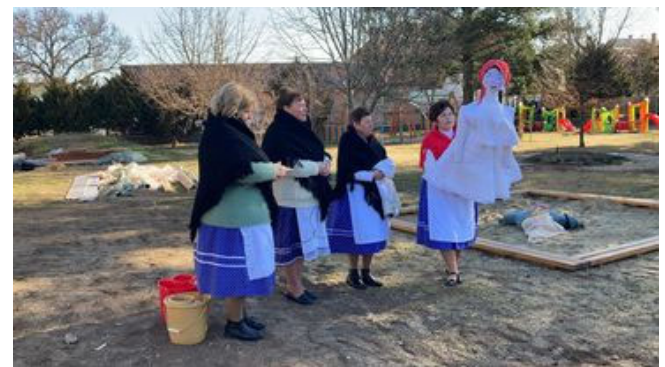
Télúzés, kiszebáb égetés