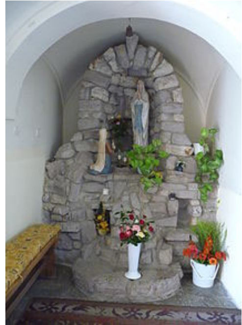
Megújult a lourdes-i barlang