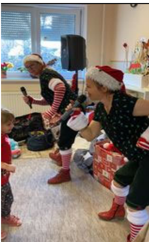
Karácsonyi ünnepség a Réparetekmogyoró együttesel