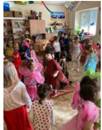
Farsangolás az Őszirózsa Nyugdijas Klubbal