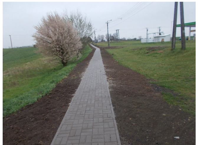
Az Ifjúság út felé vezető járda

A Magyar Falu Program Önkormányzati járdaépítés, felújítás anyagtámogatása – 2020 című, MFP-BJA/2020 kódszámú nyertes pályázat keretében a Palotás belterület 725. hrsz. alatti járda anyagköltségére nyert Palotás Község Önkormányzata 4.933.104 Ft támogatást, amelyet felhasználva elkészült a benzinkút mögötti területen az Ifjúság út felé vezető térkövezett járda.