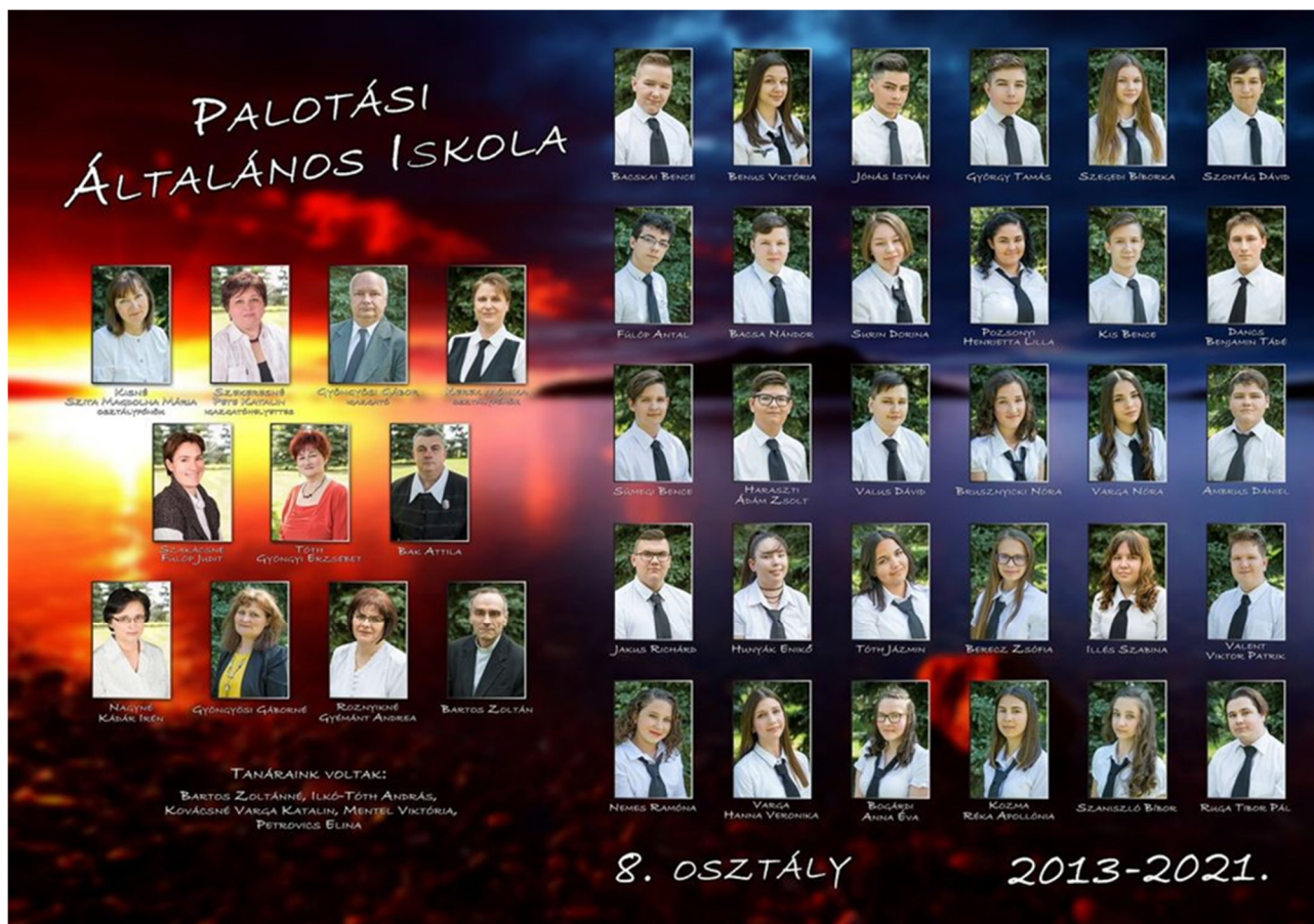
A ballagó nyolcadikosok tablóképe (2013-2021)