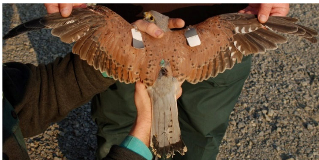
Finnországban megjelölt, Palotáson áramütést szenvedett vörös vércse, amely még évekig élt a Bükki Nemzeti Park Igazgatóság madármenhelyén

A „madaras esetek” egyik gyakori típusa, amikor áramütötte, közlekedési balesetben vagy egyéb módon megsérült madár kerül kézre. Palotáson, közép-feszültségű oszlop alatt például találtak már vörös vércsét, lakás teraszán sérült szárnyú kuvikot, a tóparton pedig rátekeredett horgászkesztyűvel a lábán fehér gólyát, bütykös hattyút.