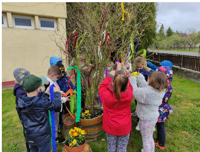
Az első osztályosok is díszítették a májusfát

Kicsiny fűzfánk, mely valószínűleg a sok törődés eredményeképpen kizöldellt, új szerepet adtunk: májusfává díszítettük a helyi lakosok és az iskolás gyerekek segítségével, akik nagy örömmel kötötték fel rá színes szalagjaikat. Nagyon szép lett, köszönet érte.