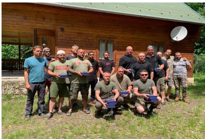
Az első helyezést elért csapat