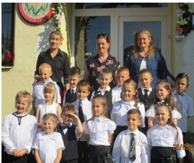
A ballagó óvodások és ballagtató pedagógusaik