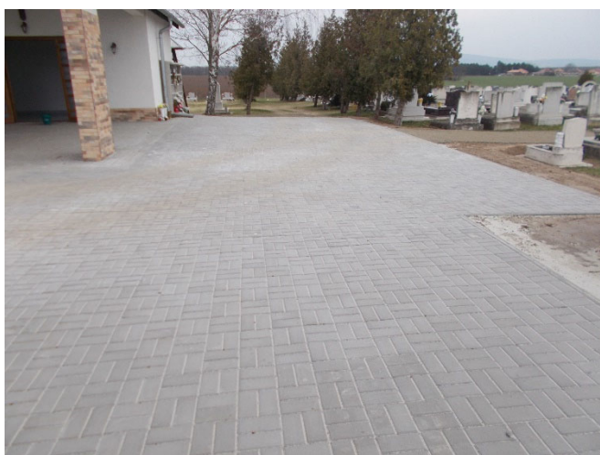
A ravatalozó melletti térburkolat

A Magyar Falu Program Temetői infrastruktúra fejlesztése – 2020 című, MFP-FVT/2020 kódszámú nyertes pályázat keretében a palotási köztemető térburkolás anyagköltségére 5.000.000 Ft vissza nem térítendő támogatást nyert Palotás Község Önkormányzata, amelyből elkészült a ravatalozó melletti területen a térburkolat, hogy a temetési szertartásokhoz méltó környezetet tudjunk biztosítani.