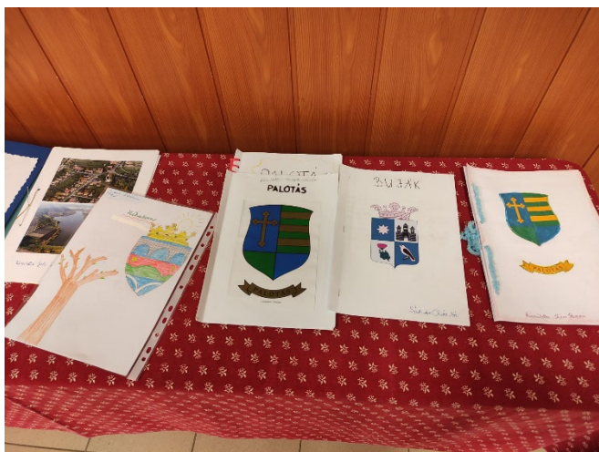
Települések bemutatása a Magyar Kultúra Napja alkalmából

Február elején kezdődött a nyolcadikosok szóbeli vizsgája. Ez a járványügyi szabályoknak megfelelően zajlott. Most sem volt könnyű a leendő tanáraikkal beszélgetniük, bizonyítani tudásukat, műveltségüket hol magyarul, hol angolul, mindezt maszkban. Február közepén a hetedikesek újraélesztési gyakorlaton vettek részt. Ebben a hónapban kezdtük keresni pedagógiai asszisztensünk utódját. Állás-hirdetésünkre 20 (!) jelentkező pályázata érkezett.