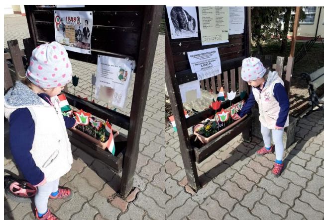
A kislányok saját kezűleg készített nemzetiszínű virágaikat is elhelyezték

Húsvét ünnepéhez kapcsolódva új, tavaszi ablakdekorációt készítettünk és tojásfát állítottunk az intézmény előtt, amelyre várjuk a lakosság által készített húsvéti tojásokat. A tojásfa díszítéséről várjuk a fotókat is, melyeket kérjük, töltsenek fel a művelődési ház közösségi oldalán erre a célra létrehozott albumba vagy küldjék el email címünkre (mihalyfierno@gmail.com)!