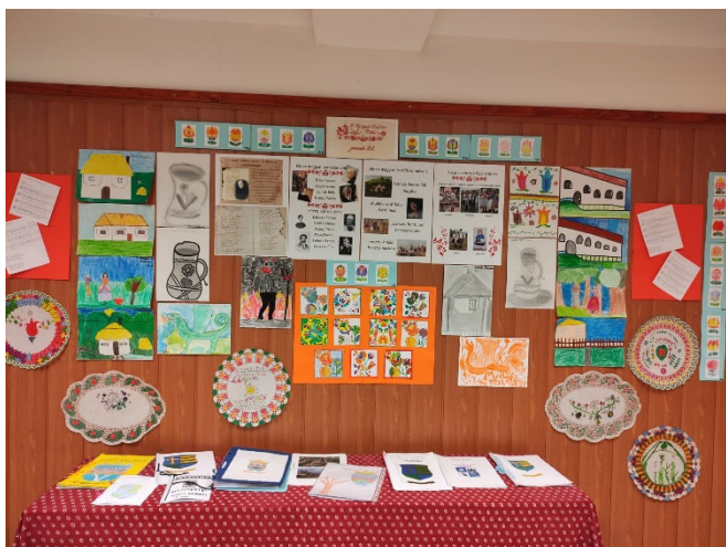
Kiállítás a Magyar Kultúra Napja alkalmából

A félévi értesítők kiosztására, a második félévi órarend bevezetésére január végén került sor. Ezt a dokumentumot a szülők digitális úton is megkapták. A Magyar Kultúra Napjának alkalmából az alsós gyerekek különleges kiállítással kedveskedtek iskolatársaiknak.