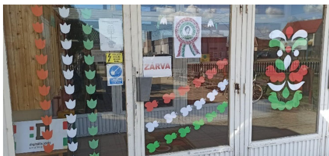
Ünnepi dekoráció március 15-én

Könyvtárunk március 18. és 25. között az Internet Fiesta országos rendezvénysorozathoz a megyei könyvtár segítségével, két online játékkal kapcsolódott: egy mesehősökről szóló memóriajátékkal és egy írókról költőkről és szerelmeikről szóló játékkal. 144-en vettek részt a játékokban közösségi oldalunkon. Köszönjük az érdeklődést!