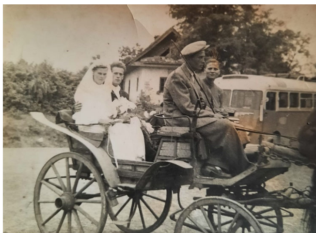
Pálteleki menyasszonyt és vőlegényt hoznak esküdni, Palotásra az 1950-es évek közepén