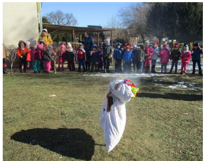
Kiszebáb-égetés az óvoda udvarán