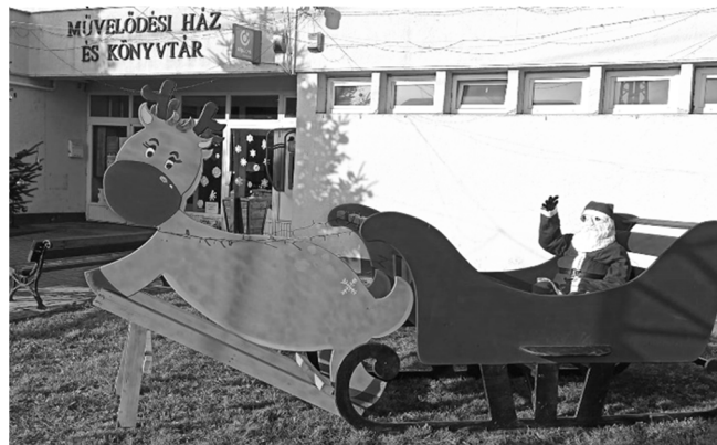
Mikulás a Művelődési Ház előtt

A falu Mikulása idén sajnos nem kelhetett útra és rendezvényt sem tarthattunk a gyerekeknek, mégis jelen lehetett a Mikulás alakja a művelődési ház előtti szánban, aki mellé oda lehetett ülni és még cukorkát is osztogatott a jó gyerekeknek.