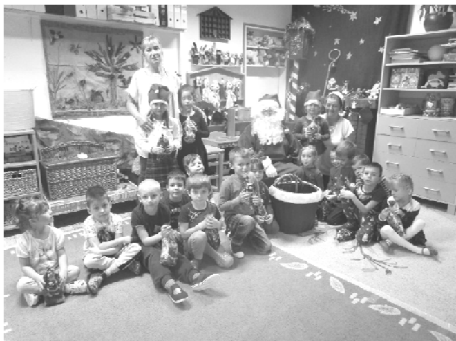
Ficánka csoport a Mikulással