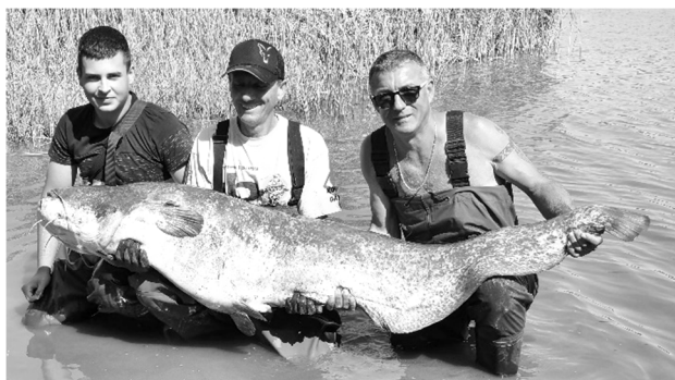
Az ideai legnagyobb kifogott harcsa 51 kg volt

A bojlis versenyeken kívül a nagyon népszerű, elsősorban egyesületi tagjaink részére meghirdetett harcsafogó verseny már hagyományórző. Annyira közkedvelt, hogy az eleinte négy napos horgászat, öt napra lett kibővítvve, a tagjaink kérését teljesítve. Ez a verseny persze versenyzésről szól, de a másik nagyon fontos a tagjainknak az, hogy családias légkörben zajlik. Az együtt bográcsolás és élmény-beszámolók teszik ezt a versenyt teljessé.