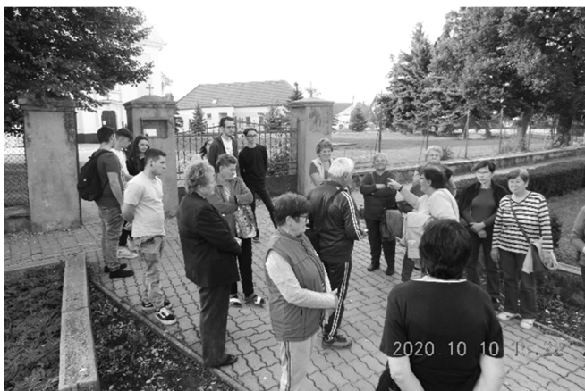
A faluséta résztvevői

Október 5. és 10. között az Országos Könyvtári Napok keretében kínáltunk többféle programot az érdeklődőknek. Ingyenes könyvtári beiratkozás, internethasználat és kedvezményes könyvvásár mellett helytörténeti vetélkedő, női torna, örömtánc, történelmi előadás és faluséta egyaránt szerepelt a kínálatban.