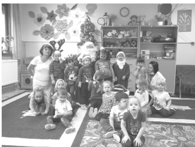
Katica csoport a Mikulással