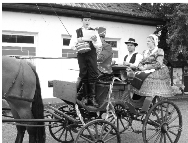
A kisbíró a híreket mondja