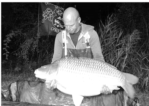
A tőrekord: 34,10 kg-os ponty

Az év elején sajnos az örömből, ürméből is került, hiszen a világvjárvány, mint mindenkit így az egyesültünket is érintette. A Kormány és a MOHOSZ által előírt szabályokat be kellett tartani, tartatni. A járvány miatt az idén kevesebb külföldi horgász tudott a tavunkra ellátogatni, de szerencsére a már meghirdetett versenyeket meg tudtuk tartani az előírt szabályok betartása mellett. Az idén három nemzetközi bojlis horgászverseny megrendezésére került sor, melyek nagyon népszerűek. A versenyzők egy hetes horgászaton méretetik meg tudásukat, melyhez azért szerencse is társul. Versenyenként több mint 10 db, 20 kg feletti ponty került kifogásra. Versenyeken kívül az év folyamán 3 db, 30 kg feletti ponty is horogra került.