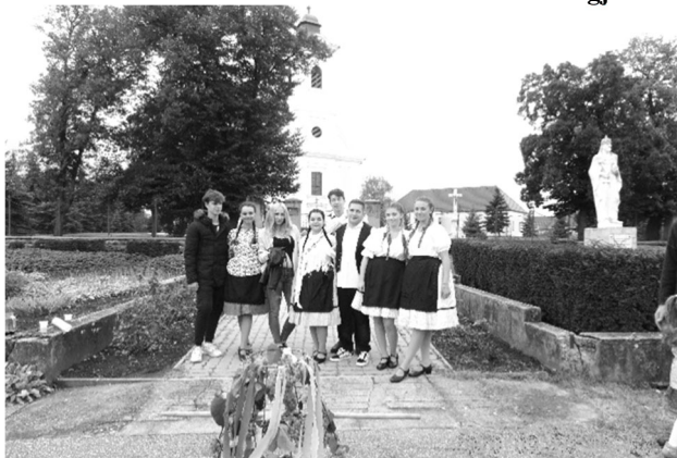
Az Ifjúsági Klub egy része a szüretin