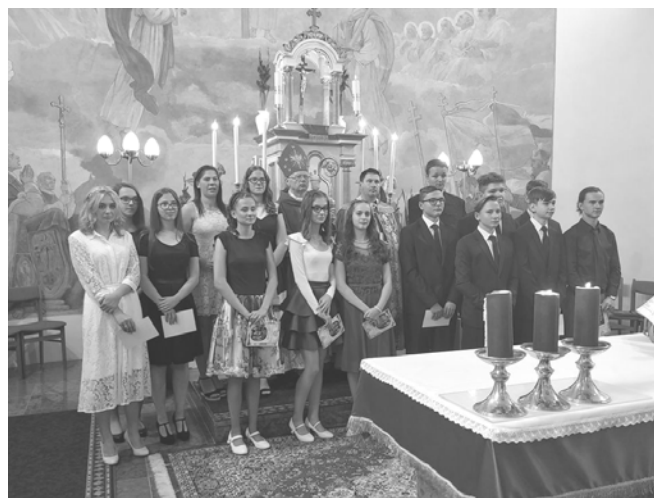
A bémálkozók csoportja