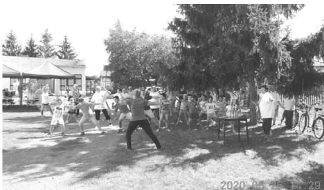
Bemelegítő gyakorlatok a vetélkedő előtt

A közös uzsonna után örömtáncal fejeződött be a program. Szeptemberben készülünk a Szüreti napra.