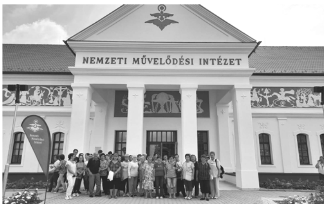
A Nemzeti Művelődési Intézet épületénél

Az idei nyár nagyon eltért az előző évektől. Elmaradtak a nagy rendezvények, emiatt nekünk is kevesebb feladatunk lett. Július közepén gyűltünk össze először a járvány kapcsán hozott korlátozások feloldása után. Majd negyvenen voltunk, hiányzott már a közösségi program. Megünnepeltük az elmaradt Nőnapot, meg a Férfinapot. Tárcsán sültött finomságokat uzsonnáztunk. Nagyon jól éreztük magunkat végre újra együtt. A következő programunk kirándulás volt. Lakitelekre látogattunk el, a Nemzeti Művelődési Intézet jóvoltából. Színházi előadást néztünk, majd egy finom ebédet kaptunk, utána körbevezettek minket a Népfőiskola területén. Nagyon szép, látványos programunk volt.