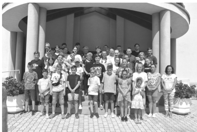
A tábor résztvevői