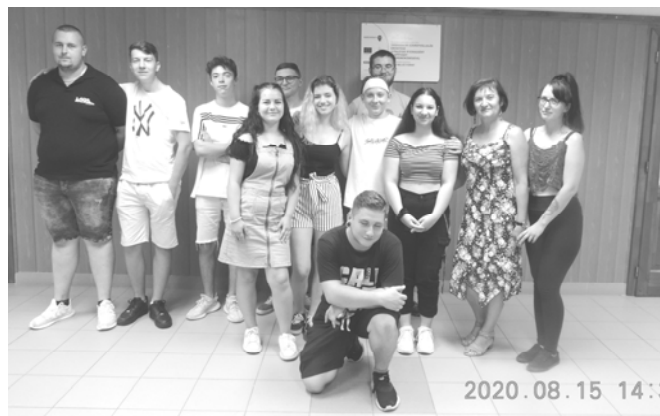
A képzésen résztvevők az oktatóval

A palotási ifjúság egy csoportja megalapította 2020. 07.07-én a Palotási Ifi Klubot. Az első összejöveteleken előre megterveztünk pár programot, amit az év folyamán meg szeretnénk valósítani.