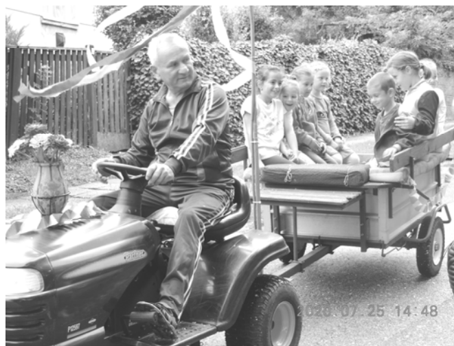
Kistraktoroznak a gyerekek

Délután 4 órakor a Lóca együttes interaktív gyermekműsorát hallgathattuk meg, ami nagyon magas színvonalú, szórakoztató előadás volt. Az együttes tagjai bemutatták a hangszereket is, amiken játszottak (hegedű, gitár, doromb, furulya, dob), és megtáncoltatták, énekeltették a közönséget.