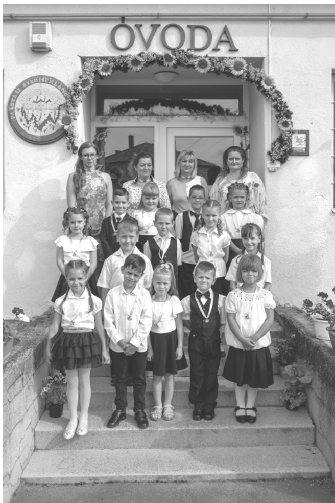
Ballagó óvodások és pedagógusaik