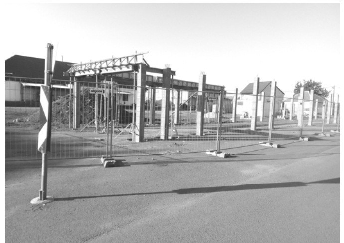
Az épülő piac