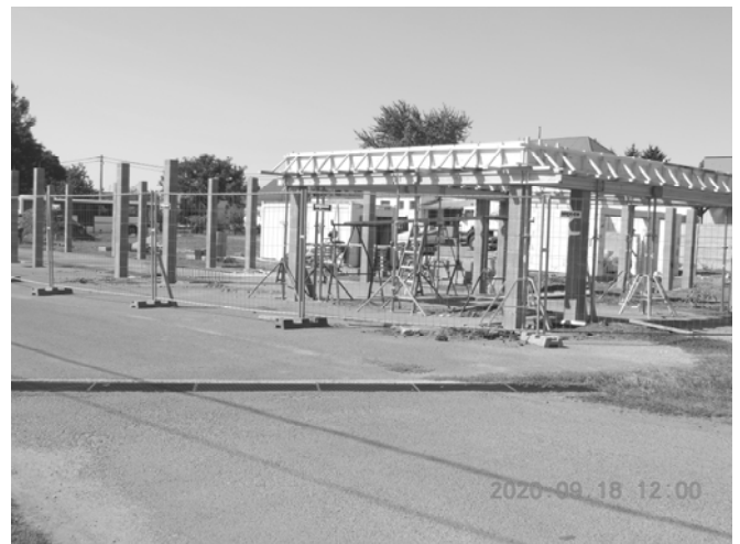
A kiszolgáló épület

Az építési beruházás tervezett befejezési ideje 2020. október 31.