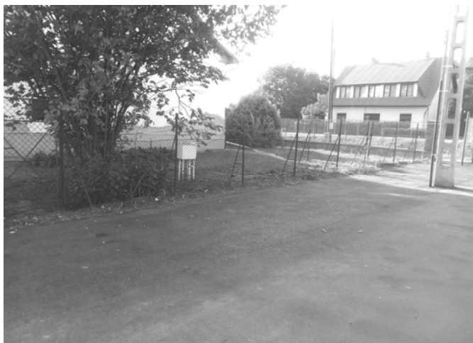
A gyógyszertár mellett kialakított parkoló

Kérjük a Tisztelt Lakosságot, hogy az Árpád úton az utat szabadon hagyva használják a kialakított parkolót.