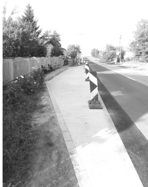
A megújult Csurgói buszmegálló öböl

Több éves egyeztetés után a Magyar Közút KHT által 2020. szeptember elején felújításra került mindkét Csurgói buszmegálló öböl. Így már biztonságosan állhatnak meg a buszok, és balesetmentesen szállhatnak fel az utasok.