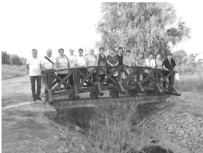
A faluséta résztvevői a Tojáshídnál