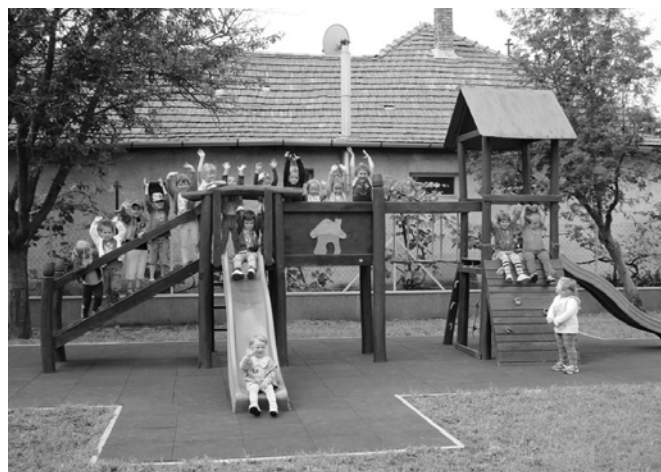
A Katica csoport játék közben