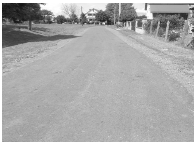
Megújult a Nefelejcs út egyik szakasza