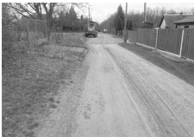
Felújításra került a Tóparti út, és a Horgász út