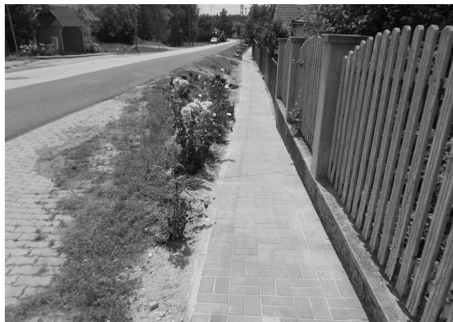
Elkészült a Szabadság út 100-120 közötti szakasz

A KÖZSÉGI BÚCSÚ ALKALMÁBÓL MEGHITT ÜNNEPET, KELLEMEK KIKAPCSOLÓDÁST KÍVÁNUNK MINDEN KEDVES OLVASÓNKNAK, KEDVES VENDÉGEINKNEK ÉS A KÖZSÉG LAKÓINAK!