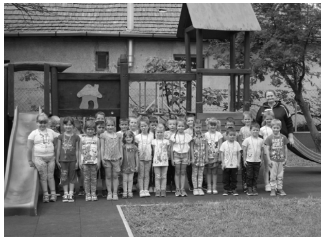
A Ficánka csoport tagjai az óvodavezetővel