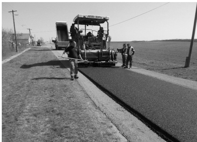
Aszfaltburkolatot kapott a Határ út

Pályázati támogatásból megújultak a települési utak és a Szabadság úti járda egyik szakasza