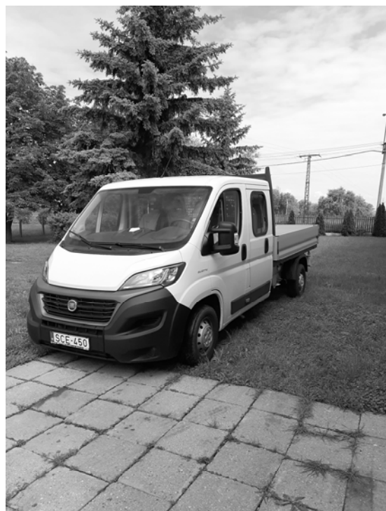
A beszerzett kisteherautó

Palotás Község Önkormányzata a 2020. évi költségvetésébe betervezett kisteherautót, egy Fiat Ducato 3,5t 2.3 Mjet 140 LE dupla kabinos változatban beszerezte a legkedvezőbb ajánlatot adó Autóforum Riegler Kft-től 6.169.000 Ft + ÁFA összegért. A kisteherautót az önkormányzat 2020. április 29-én vehette át Tatabányán, amelyet a településüzemeltetési feladatok ellátásához és a zártkerti övezetben a szemétszállítási feladatok megoldásához használ, amely nagyban megkönnyíti a feladatok elvégzését.