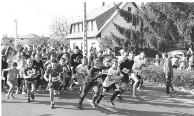
XIII. Biomed Tókerülő Futás: rajtol a rövidtáv

A XIII. Biomed Tókerülő Futást október 27-én rendeztük meg, melyről külön beszámolót olvashatnak az újság hasábjain.