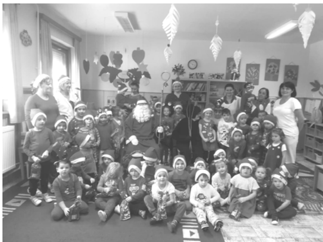
Ellátogatott az óvodába a Mikulás és a Krampusz

December 7-én a település Adventi - koszorújánál, a II. gyertyagyújtás alkalmával képviseltük intézményeinket. December 18-án, a Szülői Szervezet jóvoltából Petőfibányai bábművészek tették meghittebbé előadásukkal az ünnepi ráhangolódást, majd gyermekeink izgatottan fedezhették fel a karácsonyfa alatt megbúvó autót, társasjátékot és ajándékokat.