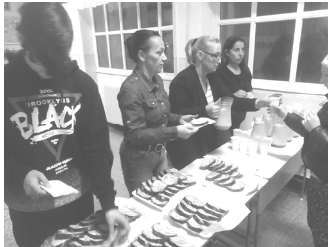
Kínálják a szülők a finom kalácsot és kakaót a résztvevő gyermekeknek

November 8-án tartotta a Diákönkormányzat a Márton napi programokat. Délután meseelőadást, illetve vetélkedőt szerveztünk a résztvevőknek. Talán a nap leglátványosabb eleme az esti lámpás felvonulás volt. Itt a gyerekek és felnőttek a községben körbejárva énekeltek, ezt követően az iskolában tábortűz mellett – régi emlékeket felidézve – kakaóval és kaláccsal kínálták a résztvevőket. Ezután egy gyermekeknek szóló film megtekintésével zártuk a napot. Közel 200 gyerek és felnőtt vett részt az eseményen, amely így a legnagyobb rendezvényeink sorába lépett.