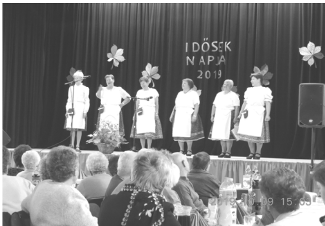
A klubtagok vidám műsora

Dalba foglalva a település, és a nyugdíjas klub eseményeit, igyekeztünk vidám perceket szerezni hallgatóságunknak.