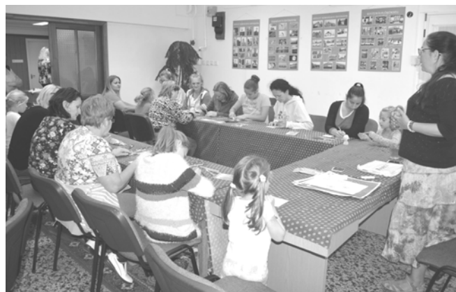
A mandalafestés játékony hatásai

Nőnek lenni jó címmel nőknek szóló, testi és lelki feltöltődést szolgáló programot szerveztünk. Közreműködők és résztvevők számára egyaránt feltöltődés volt ez a nap.