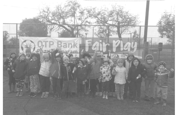
A Bozsik program ovis résztvevői