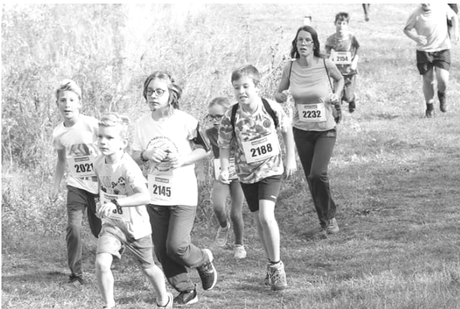
A tókerülő futáson

A középiskolák képviselői látogattak el nyolcadikosakhoz, hogy segítsenek nekik a továbbtanulással kapcsolatos döntéseikben. Nyílt napokon vettek részt a pályaválasztás előtt álló végzőseink.