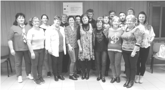
A kommunikációs tréning résztvevői oktatójukkal

November 30-án adventi díszeket készítettünk hagyományörző kézműves foglalkozás keretében.