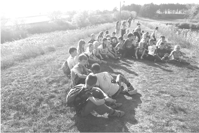
Ki a legény a gáton?

A Tókerülő futáson minden harmadik tanulónk részt vett. A Biomed által felajánlott legaktívabb osztály díját, 30 000 forintos utalványt az ötödikesek nyerték közel hetven százalékkal.