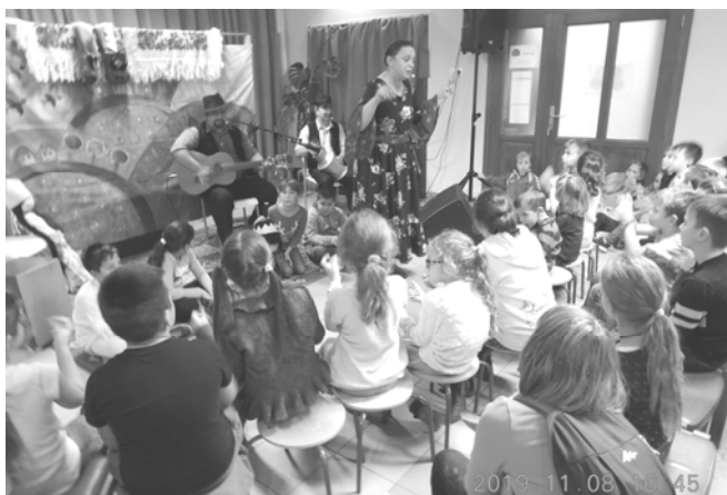
A Paramisi Társulat előadása

November 8-án családi napot tartottunk intézményünkben és az általános iskolában a Palotás Ifjúságáért Alapítvány pályázati programja keretében.