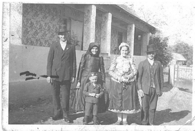
Szabó Imre háza 1938-ban (Szabadság út 79.) (a ház jelenleg a község tájháza)