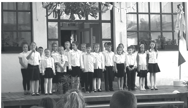
„Becsengettek” – a másodikosok évnyitó műsora