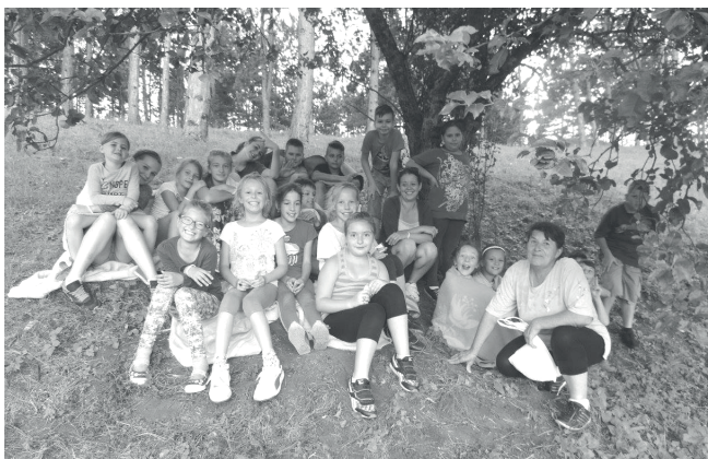
Táborozók a vadalmafa alatt