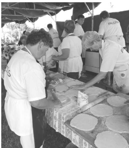
A falunapi szorgos csapat

Vegyük sorra mivel is telt el ez a nyár. Először is, ami a nyárhoz tartozik, strandolással. Az egyik alkalommal Nagykátára, másodsorra Zsóryba mentünk felfrissülni. A pihenés mellett sok feladatunk is volt, hiszen a falunapra hetekkel előbb megkezdtük a próbákat. Egyik csoportunk táncsal, másik a régi paraszti élet felelevenítésével szerepelt a műsorban. Emellett sütöttük a laskát, tócsnit, egy csoport pedig bográcsban főzött. A klubtagok nagy része kint sürgött a konyhasátorban. Mindenki talált magának feladatot, nagyon összehangoltan, és persze nagyon jó hangulatban végezte mindenki a munkáját. Amit készítettünk, mind elfogyott az utolsó falatig.