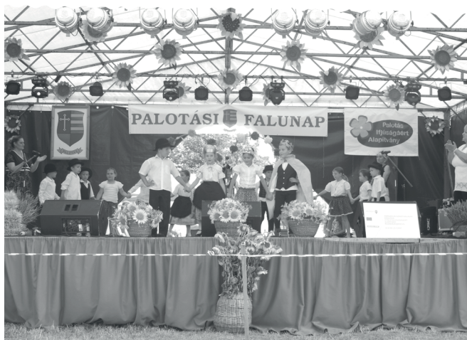
A Palotási Gyermeklanc Óvoda növendékeinek műsora

A versenyek eredményhirdetésére ezt követően került sor. A környező településekről idén, a Héhalmi Boszik fogadták el a meghívásunkat, s vidám műsorral szórakoztatták az egybegyűlteket a színpadon és a közönséget is táncba hívták. Becsó Zsolt országgyűlési képviselő és Skuczi Nándor a Nógrád Megyei Közgyűlés elnöke is megtisztelték bennünket jelenlétükkel, köszöntőjükben méltatták településünket, közösségeinket, intézményeinket. A Hatvani Dream Kutyaiskola tagjai bemutatójukba a gyerekeket is bevonták. Zsuzsa Mihály magyar nótá énekes a közönség tagjait is táncra perdítette. Erox Martini olasz slágereket énekelt. A Csini Tini Mazsorett Csoport, az Ipoly Táncgyűttes és a Tücsök Népzenei Együttes Mihálygergéről érkeztek hozzánk és fergeteges műsorral szórakoztatták a közönséget. Ezt követően a sztárfellépőké volt a színpad: Janicsák Veka és Bereczki Zoltán műsorát, valamint a Szabad Élet Zenekar koncertjét láthatták, hallhatták a résztvevők. A programok sorát tűzijáték és szabadtéri bál zárta.