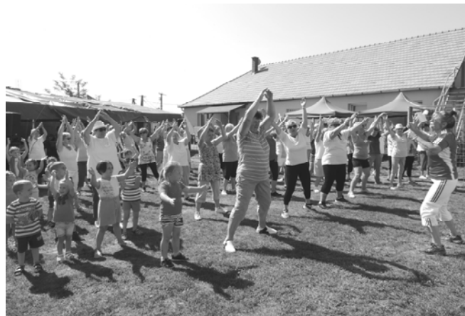
A sportverseny előtti bemelegítő torna

vevője is táncolt. A hangulat addig fokozódott, hogy az üstházról lekerült a füstcső, és Sportpálya állomásról elindult a vonat. Egy nagyon vidám napot töltöttünk együtt, nagyon sokan, idősek, fiatalabbak, gyerekek. Vendégeink azt mondták, jönnék jövőre is.