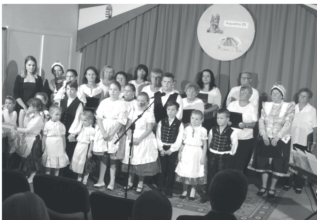
Az ünnepi műsor szereplői