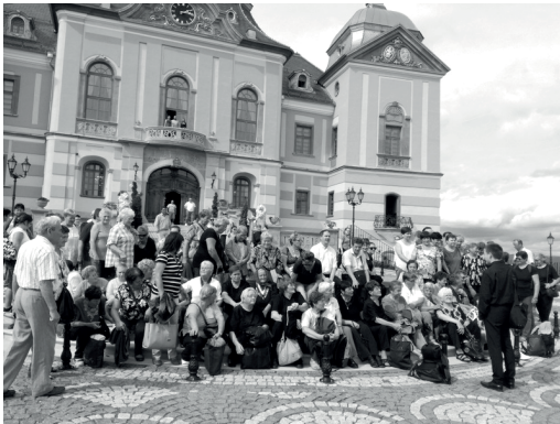
A kirándulók Gácson

A Szent Péter és Pál templombúcsút követően egyházi életünkben is beköszöntött a nyár. A húsvéti ünnepkör lezárása, Úrnapija után hosszabb, úgynevezett évközi időszak kezdődött. A diákok is megkezdték megérdemelt vakációjukat és a határban, valamint a kertekben is megkezdődött a nyári betakarítás. Augusztus 13-án ünnepelte a sziráki templom Nagyboldogasszony búcsúját. A szentmisén a palotási hívek is részt vettek. A hagyományos ministráns tábor idén augusztus 21-25. között zajlott Balatonszemesen. A palotási és a bujádi fiatalok együtt táboroztak. Több mint 40 fő vett részt a táborban, ahol a Balaton vizének élvezete mellett meglátogatták a Siófoki Aqua parkot, és minden nap részesülhettek szentmise áldozatban is. A közös vacsorákra pedig meghívták a helyi plébánost és kántort. Szeptember 2-án az őszi kiránduláson vehettek részt a hívők, akik ezúttal felvidékre, de nem is olyan messzire, Losoncra és Gácsra tettek látogatást. A 21-es út felújítása miatt ugyan késéssel érkeztek meg, de a látnivalók kárpótolták őket a kellemetlenség miatt. Délután a Gácsi templomban megtartott litánia után indultak haza, nyerve lelki felfrissülést és teljes búcsút.