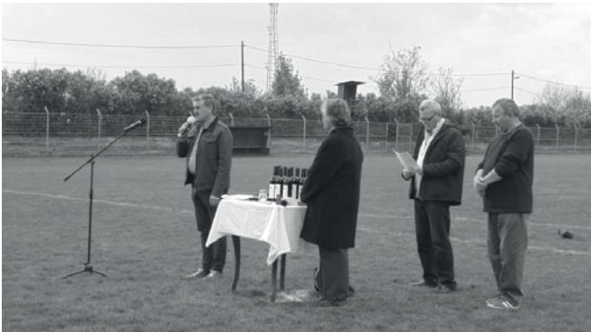
A megnyitó pillanatai

2017. április 15-én újabb találkozóra került sor a Palotási Sportcentrumban. A résztvevői az 1971-72 évi megyei I. osztályt nyert csapat tagjai, az NB III.-ban résztvevők, a későbbi bajnoki csapatokban szereplők közül kiemelkedőt nyújtók, valamint meghívott illusztris vendégek voltak. Percre pontosan 9 órakor - „mintha a játékvezető a kezdő sípszót megadná”- megjelentek az ebéd elkészítésével megbízottak. Szervezetten folyt a munka, a tervezett babgulyáshoz a bevásárolt alapanyagok feldolgozása, üstbeállítás, a büfé étkezéshez való berendezése. Megérkezett a hangosításért felelős személyzet is. Hangfalak, erősítés beállítása, hangpróba... „minden alright”. Beindult a babgulyás főzése is miközben már érkezett néhány meghívott, kik szívesen segédkeztek az előkészítésekben, hisz közösségben az erő . A későbbiek a megírt „forgatókönyv” szerint zajlottak. Az ünnepség szinte percnyi pontossággal a tervek szerint zajlott le. A megnyitóbeszéd, ünnepi köszöntő ideje alatt néhány arcon a visszaemlékezés tükrében meghatódottság jeleit lehetett felfedezni.