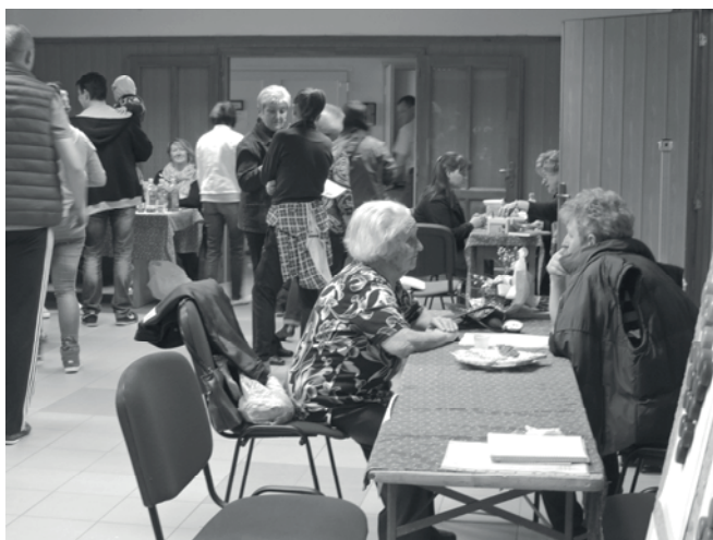
Az egészségnap résztvevőinek egy csoportja

Jöjjenek el, nézzenek szét, beszélgessenek, tájékozódjanak, gyönyörködjenek a virágokban (ez egyedülálló a környéken!), beszélgessenek egymással! Tegyük többet testi-lelki egészségünkért!