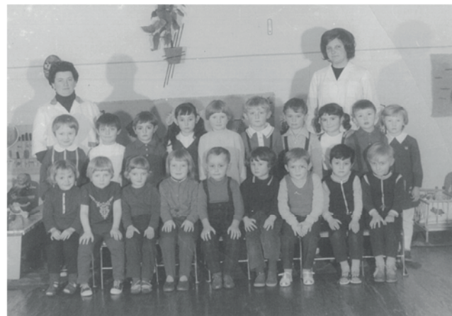
Palotási óvodások 1972/1973-ban