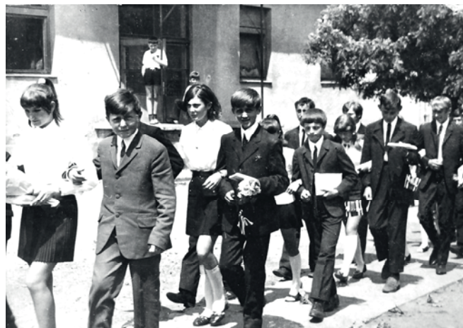
Iskolai ballagók 1971-ben