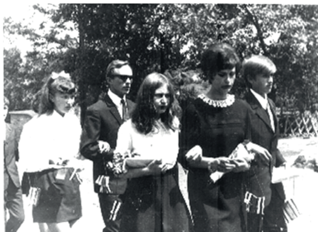
Általános iskolai ballagás, 1971.