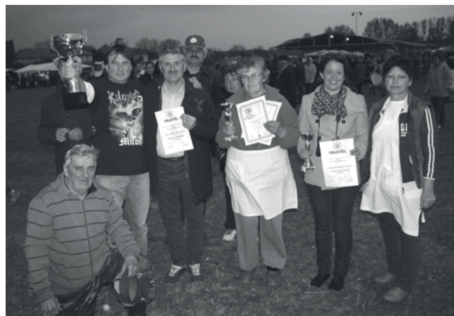
A bajnokcsapat egy része a díjakkal

díjazott lett a sütemény, a pálinka és elnyertük a III. Böllér Bajnokok Ligája leghagyományosabb udvara címet is, valamint a legnagyobb díjat is Palotás község érdemelte ki: a 2017. év Böllér Bajnoka címet.