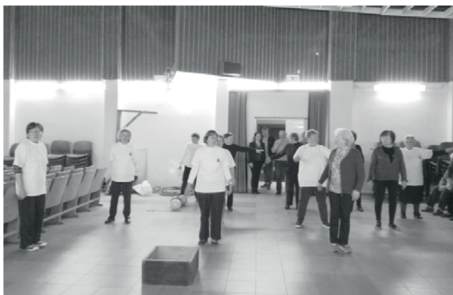
A sportverseny résztvevői

Az előző beszámolómat március közepénél fejeztem be, de még ehhez a hónaphoz tartozik egy esemény, amibe mi mindig bekapcsolódunk, ez az Egészségnap. A finom és egészséges salátákat, krémeket kínáltuk kóstolásra. A költészet napja tiszteletére rendezett vers- és prózamondó versenybe két klubtagunk is benevezett, a sok fiatal résztvevővel együtt szórakoztatták a hallgatóságot. Húsvét utáni héten szabadtéri sportnapunk lett volna, de az idő nem engedte, esett az eső, és nagyon hideg is volt, kénytelenek voltunk fedett helyre húzódni. A Művelődési Ház színháztermét átrendezték nekünk, hogy ne maradjon el a betervezett program. Köszönjük a segítőkész hozzáállást. Olyan feladatokat találtunk ki, amit a teremben el lehetett végezni, így jól szórakoztunk. Vidáman telt a délután, némi mozgással, sok nevetéssel.