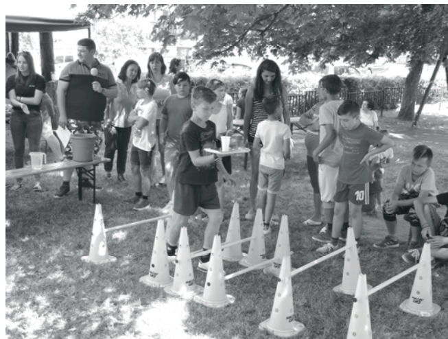
Családi vetélkedő a Palotás Ifjúságáért Alapítvánnyal