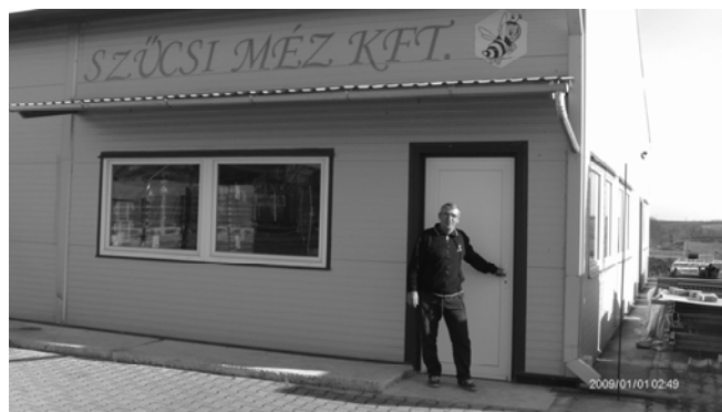
A jelenlegi csarnok az üzlet bejáratával

A közeljövő tervei között szerepel egy Uniós pályázat beadása, melynek keretében 1800 m 2 -el bővítik csarnokukat, melyben a jelen tevékenységet vinnék tovább nagyobb volumenben.