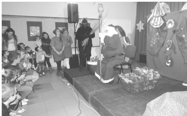
Megérkezett a Mikulás és segítőtársai