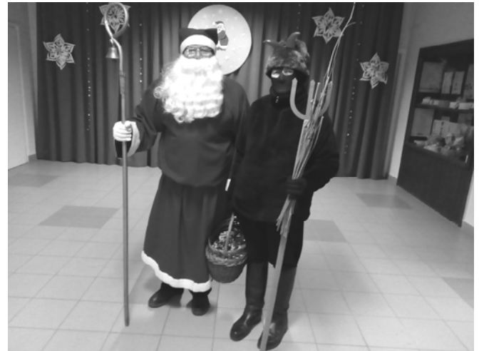
A Mikulás és a Krampusz