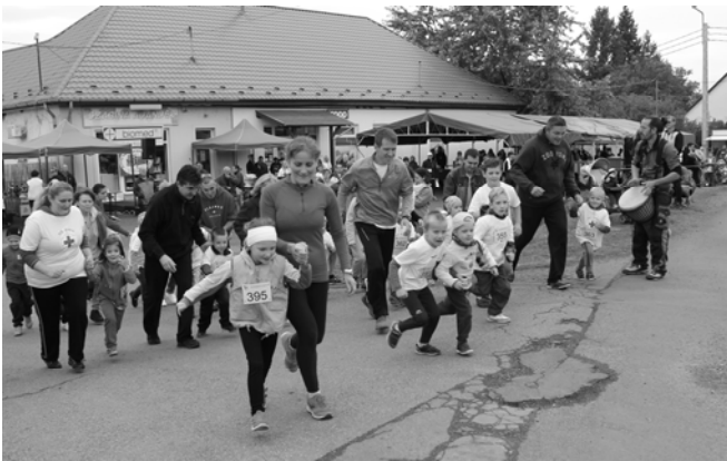
Az ovis futás rajtjának pillanata