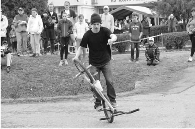
A flatland bmx bemutató