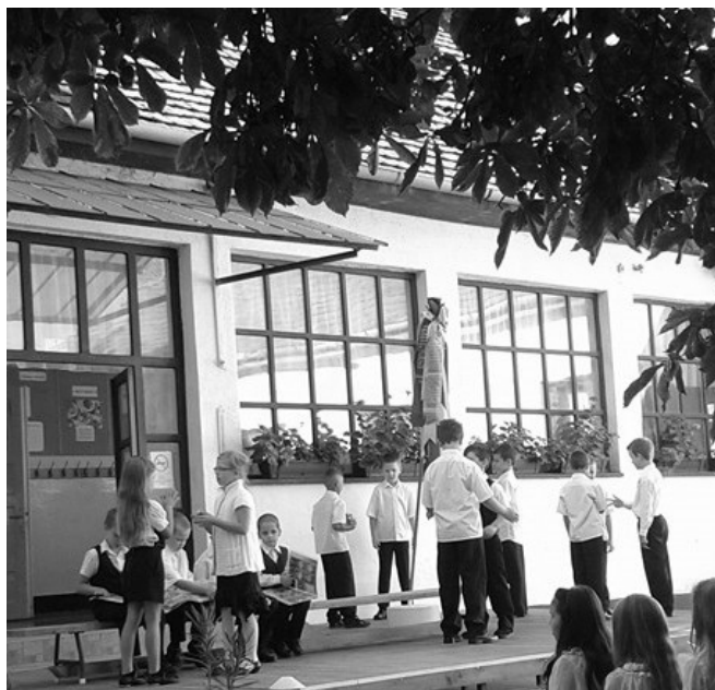
A másodikosok évnyitó műsora