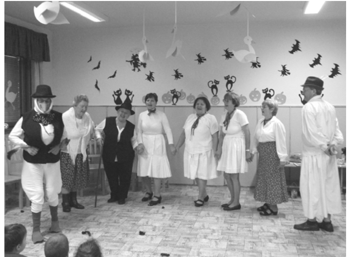
A Nyugdíjas Klub tagjai a Márton napi előadáson

Nagyon szépen köszönjük a szülőknek, hozzátartozóknak, a települések valamennyi kedves lakójának, hogy gyermekeink érdekében hozzájárulnak az óvoda programjainak színesebbé tételéhez. A teljesség igénye nélkül köszönjük: a palotási Őszirozsa Nyugdíjasklub tagjainak, „ A magyar népmese napján ” és a „ Szent Márton napján ” bemutatott előadásait.