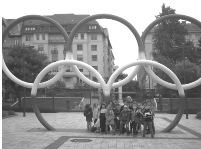
Harmadikosaink az Olimpiai parkban