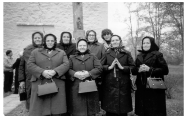
Palotásiak az egyházasdengelegi misén 1984-ben