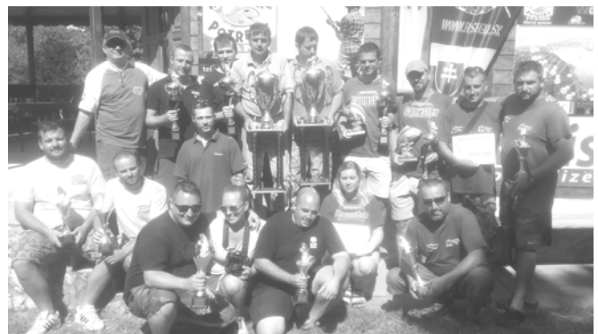
A helyezést elért csapatok a Nemzetközi Bojlis Horgászversenyen