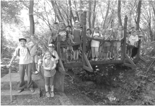
Táborozók a Mária forrásnál