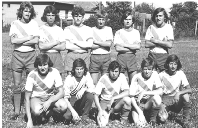
Ifjúsági labdarúgó csapat az 1970-es évek közepén