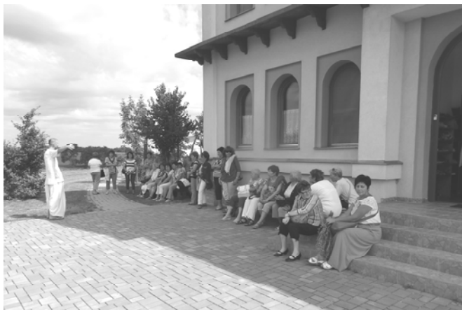
A Krisna-völgyi kirándulás résztvevői

Innen áthajóztunk Tihanyba, itt már a saját kultúránk gyöngyszemét, az Apátságot csodálhattuk meg és gyönyörködhettünk a fenséges balatoni panorámában.