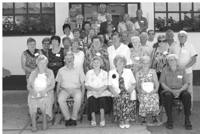
A találkozó résztvevői

Visszatértünk a Panzióhoz, ahol már javában folyt a kötetlen beszélgetés, egymást váltva mesélték élményeiket, emlékeiket, nem csoda, hiszen sokan 50 éve látták egymást utoljára. Az idő közben nagyon elszaladt, azt vettük észre, hogy ránk esteledett. Kipirult arcok, újabb pár csillogó könnyecsepp jelent meg a szemekben, elérkezett a búcsúzás pillanata. Végzőként megfogalmazódott: „5 év múlva újra találkozunk!”