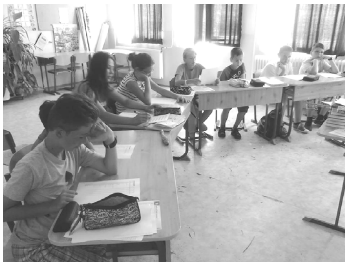
Az angoltábor legidősebb csoportja munka közben...