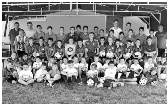
A tábor résztvevői a segítőkkel

Az edzések közötti pihenőket csocsózással, kártyázással, kvízzjátékokkal, 7-es és 11-es rúgó versenyekkel tették emlékezetessé. Volt a táborban egy különleges nap, amikor a gyerekek a focipályán sátorozhattak az éjszakában. Nagy élmény volt ez minden táborlakónak. Napi háromszori étkezés szerepelt a heti menüben és mellette még sok más finomság, ami élvezetesebbé tette a gyerekek hétköznapi étkezését.