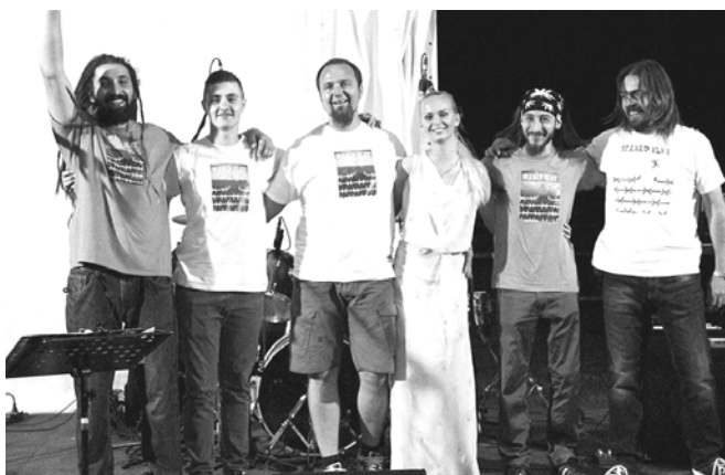
A zenekar tagjai