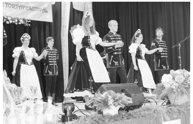
A Palotás tánc előadói a színpadon