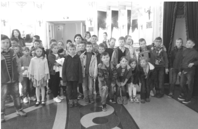
A kirándulók csoportja