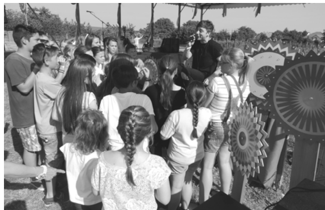
Szabyest a rajongói körében

amellyel a rendezvény programját színesítették, lebonyolítását segítették.