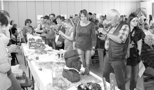
Nagy az érdeklődés a tortacsodák iránt