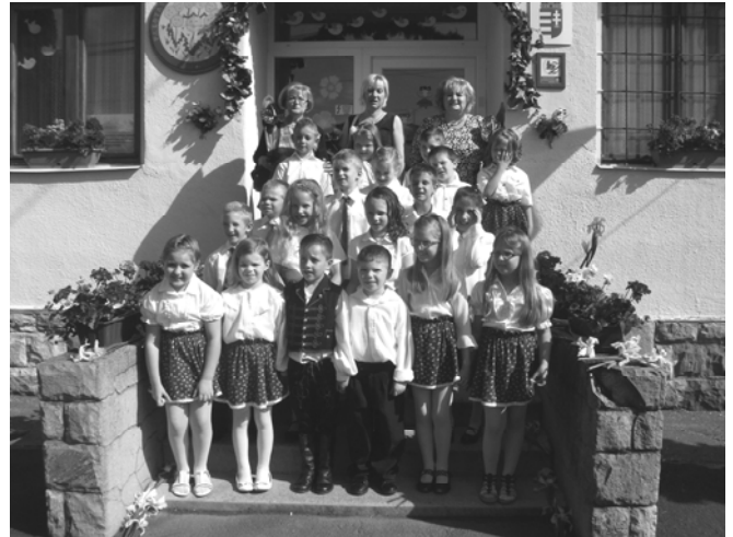
A búcsúzó nagycsoportosok és nevelők

„Óvodáskor! De szép évek! Sosem felejtünk el Téged.” (Tali Gitta: Óvodáskor)