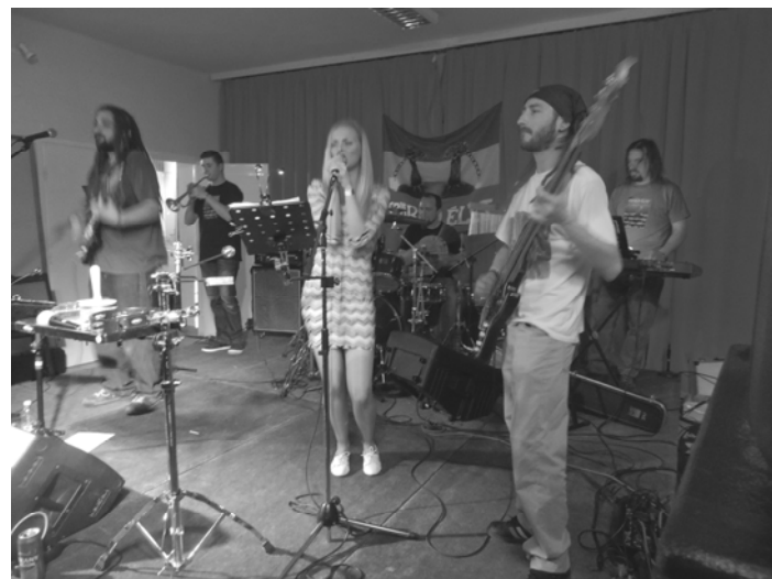
Mamusz Fesztivál, Palotás 2016