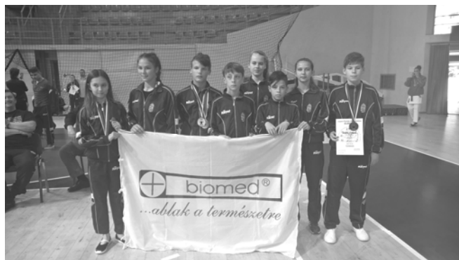
A karate Európa-Bajnokság palotási csoportja