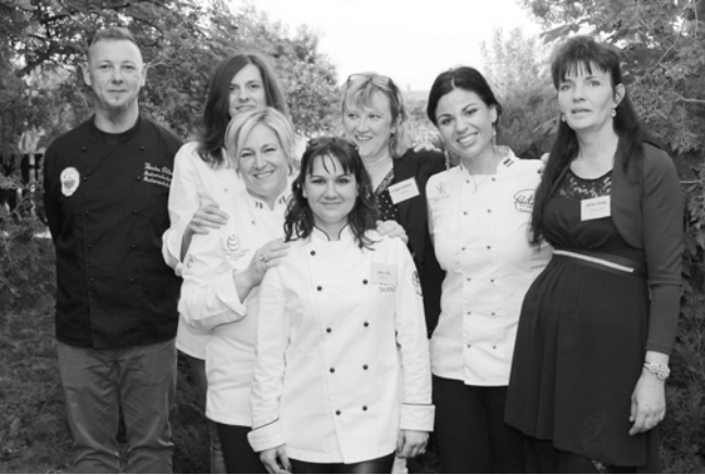
A zsűri tagjaival