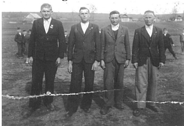
A Péter-Pál napi búcsúban az 1950-es években