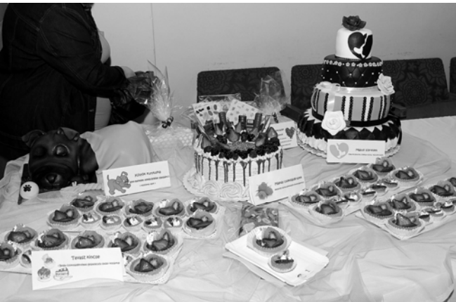
Kreációk a versenyen