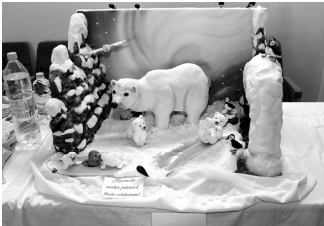
Palotás Község Önkormányzata, a közönség és a Tortadíszítés magazin különdíját is kiérdemlő alkotás