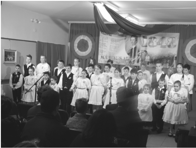
Az ünnepi műsor közreműködői