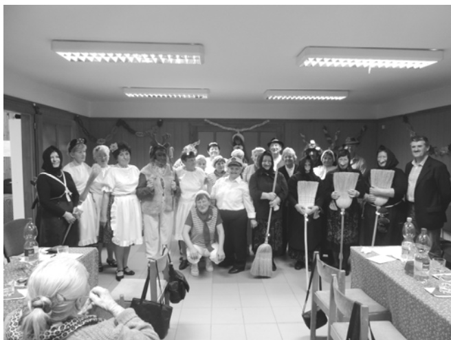
A jókedvű farsangi mulatság szereplői a polgármesterrel

Aztán jött a fergeteges farsang. A boszorkák hadát a részeg tengerészek váltották. Majd a cigánytáncot ropták a beöltözött fiúk. A dudaszóra táncoló „kislányok” után a viccet mesélő is megjelent. No, a táncoló apáca sem volt akármí!