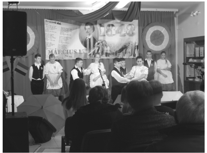
A Kenderike Néptáncsoport műsora