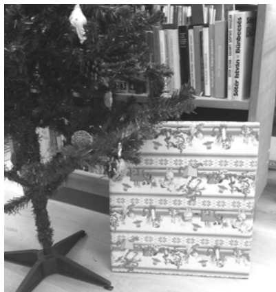
A becsomagolt ajándék darts tábla

Úgy döntöttünk, hogy az összegből - amit a Cserhátalja Folklórünnepen a palacsintasütéssel gyűjtöttünk össze - meglepjük a fiatalokat egy kis ajándékkal. Készültünk süteménnyel, üdítővel, karácsonyi égőssorral, a fiatalok egyike, biztosította számunkra zenét. Miután mindenki megérkezett, átadtuk a becsomagolt ajándékot, amit izgatottan kezdtek el kibontani: egy elemes darts táblát.