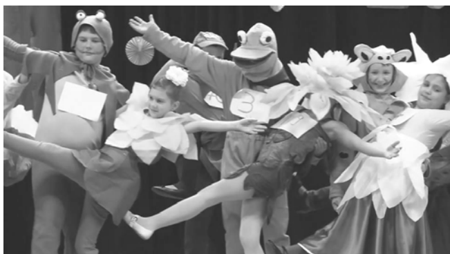
A harmadikosok farsangi produkciója

A karácsonyi ünnepek után a téli szünetben a diákoknak sikerült kipihennie a fáradságukat, így újult erővel vágtak bele a mindennapi teendőikbe. Az első félévet lezárva, tanulóink bizonyítványt vittek haza az elmúlt időszak tanulmányi eredményeiről. Januárban az iskola felsős tanulói hatvani jégpályán hódolhattak a korcsolyázás örömeinek. Emellett gőzerővel készültek az osztályok a farsangi mulatságra. A rendezvény nagy sikerrel zajlott le az iskola és a szülők sikeres együttműködésének, illetve a szervező, negyedik és ötödik osztályok munkájának köszönhetően. A fellépés sorrendjében: Negyedikesek a dzsungel mélyére repítettek minket. A Diákönkormányzat modern táncprodukcióval készült. Az első osztályosok Tarzanos jelenetet adtak elő. A másodikok honfoglalókká váltak. A harmadikosok tavi tangót mutattak be.