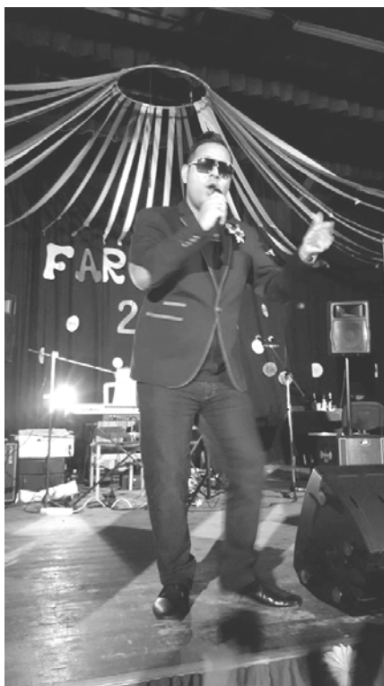
A sztárvendég: Bódi Csabi

A rendezvény vacsorával folytatódott. Szeretném megköszönni minden szülőnek, aki a felszolgálásban türelmesen segített, hiszen ennyi vendéget nem volt egyszerű kiszolgálni. Köszönöm lányok! Vacsora után kezdetét vette a vidám szórakozás, és megérkezett az első meglepetés vendégünk, Bódi Csabi, aki fergeteges hangulatot teremtett.