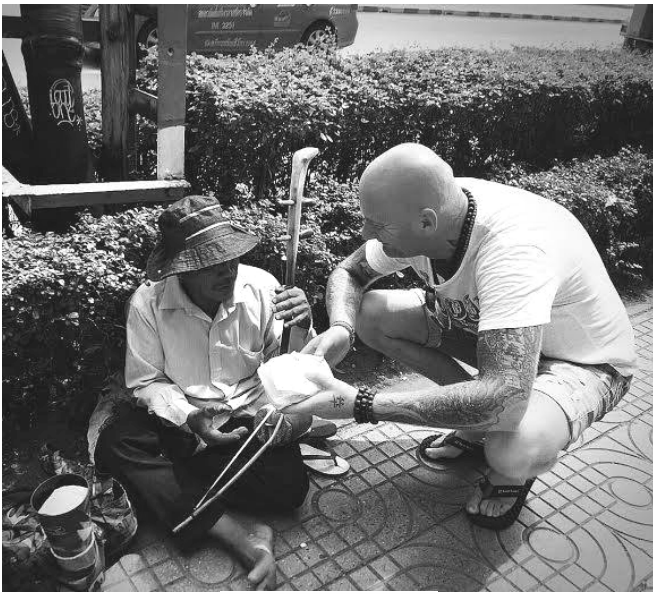
Egy segítséget váró

Viszont ennek ellenére hihetetlen vendégszeretőek. Behívnak rozzant otthonaikba, és amijük van, szívesen osztják meg másokkal. Ilyenkor a helyi ételekkel kínálnak, amit ők is fogyasztanak nap, mint nap. Tábortűz, helyi zenekar, kézzel evés, minden a legnagyobb profizmusban. Viszont ne lepődjünk meg, ha sült patkány, hangyás hús, sült bogarak kerülnek a tányérunkra. Előtte a gyomrunkat fel lehet készíteni pár adag rizspálinkával, hogy ne kapjon sokkot. Utunk jelen állomása is épp ezen a területen élő embereknek kívánt valahogy segíteni. Főleg a gyerekeknek, családoknak, de végül is bárkinek, akiknek tudtunk.