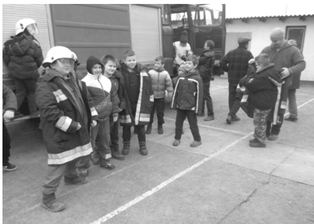
A tűzoltó egyesület bemutatóján

Ötödikesek kalózok és sellők voltak. Hatodikosok görög szirtakit jártak. Hetedikesek a jövő rendfenntartói lettek. A nyolcadikosok pedig összeállítást mutattak be korábbi produkcióikból. Jelentős összeg gyűlt össze, melyet, mint minden évben az iskola javára fordítunk. Az idei jótékonyági bálon a hatodik, hetedik és a nyolcadik osztályosok is felléptek nagy sikerrel. Februárban az iskola Valentin-napot tartott. A folyosón elhelyezett, külön ládikába dobhatták a gyermekek az üzeneteiket, melyeket barátoknak, barátnőknek vagy éppen kedvenc tanárúknak címezték.