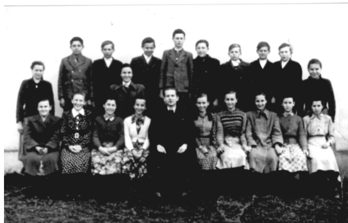
8. osztály 1952-ben