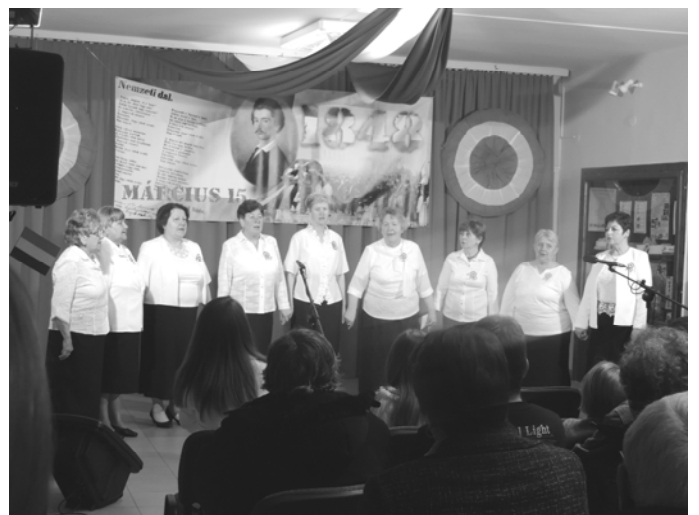
Az Őszirózsa Nyugdíjas Klub Nótaköre

KELLEMESES HÚSVÉTI ÜNNEPEKET KÍVÁNUNK MINDEN KEDVES OLVASÓNKNAK, KEDVES VENDÉGEINKNEK ÉS A KÖZSÉG LAKÓINAK!