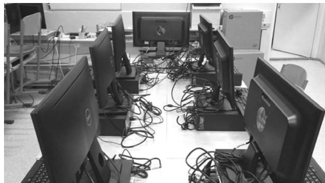
Az új, beszerzett számítógépek

A TIOP-1.1.1.A-15/1-2015-0001 azonosítójú pályázat kapcsán, iskolánk 13 korszerű asztali számítógéppel, 7 monitorral, egy szerverrel és egy hálózati elosztóval lett gazdagabb. Köszönjük! Így tovább bővült az intézmény infokommunikációs parkja.