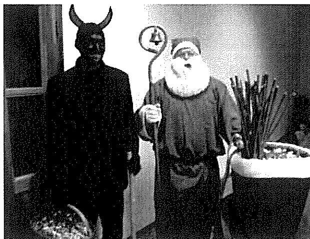
A Mikulás és a Krampusz