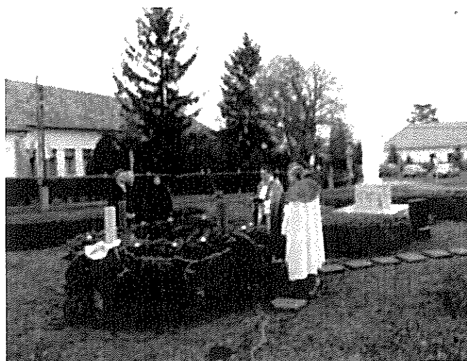
Az adventi koszorú megszentelése és az első adventi gyertya meggyújtása a templom előtti kertben