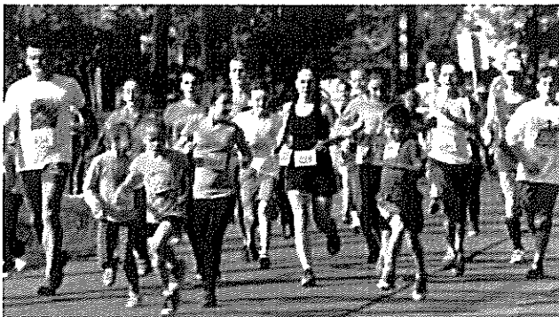
Idén is rengetegen futottak Palotásán

Gyönyörű szép idő fogadta a VIII. Biomed Tókerülő futás résztvevőit és vendégeit Palotásán. A település lakóin és a legjobb nógrádiakon kívül az ország több pontjáról is érkeztek futók, így új részvételi rekord született.