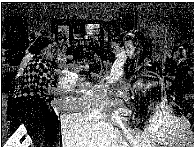
A gyerekek is kipróbálhatták a tollfosztást

November 14-én a Márton-nap hagyományait felelevenítő játszóházba invitáltunk kicsiket és nagyokat egyaránt. A Márton legenda és a Márton-napi hagyományok megismerése után, kézműves foglalkozás keretében liba írotollat, hímezett libaképet, valamint lámpást készítették a gyerekek. Az Őszirozsa Nyugdíjas Klub tagjai a tollfosztás hagyományával ismertették meg a legkisebbeket, akik maguk is kipróbálhatták ezt a tevékenységet. A résztvevőket zsíros kenyérrel, teával, sült tökkel, almával és mákos kukoricával kínáltuk.