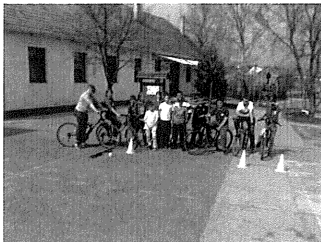
Ügyességi feladatok az iskolában