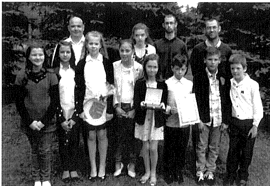
A díjazott karate klub tagjai edzőikkel

Gratulálunk a klubnak a kitüntetéshez, és további jó munkát, sikereket kívánunk!