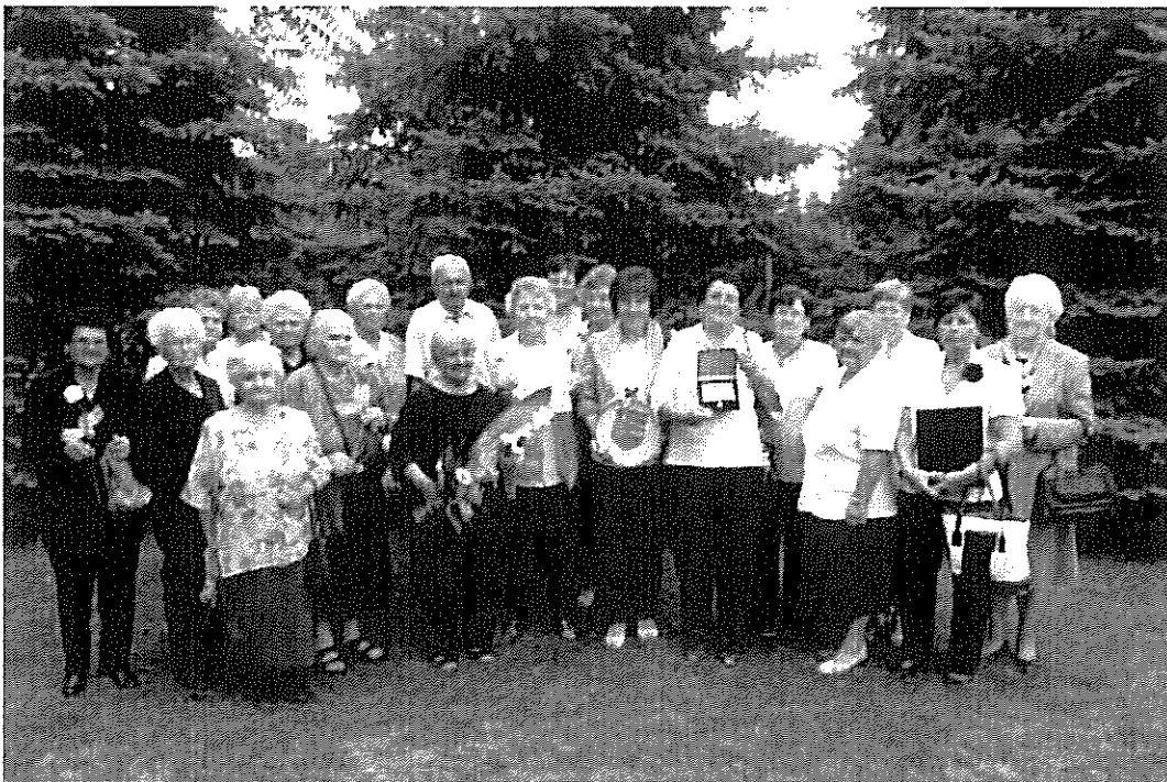
A nyugdíjas klub vezetősége és néhány tagja a díj átadásakor