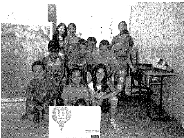
Angol tábor résztvevői

Idéi évben Afrika volt a téma, a hét lezárásaként pénteken a kisbágyoni Afrika múzeumba tettünk látogatást, ahol idegen nyelvű vezetésben részesültünk.