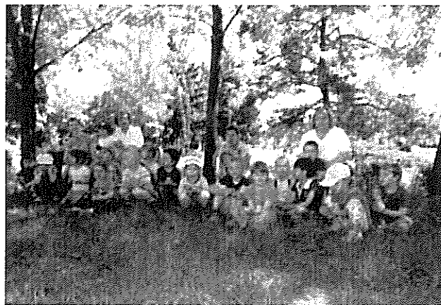
Ovisok a „Norbi farmon”