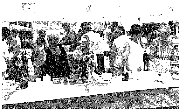
Készül a tócsni, a laska és a krumplifánk az Őszirózsa Nyugdíjas Klub szorgos kezű asszonyai által