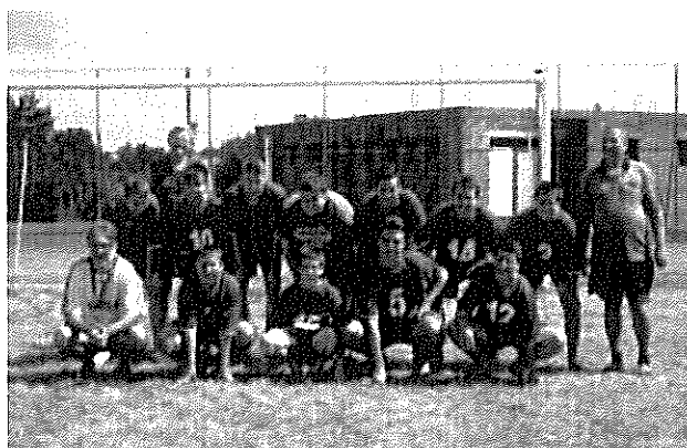
A tábor résztvevői az edzőkkel