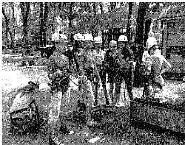
A sporttábor résztvevői Zánkán