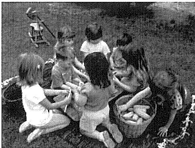
Gyermeknap az óvodában