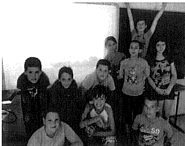
Angol tábor résztvevői