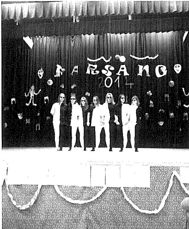
„Táncoló Talpak” csoportja

De ez még nem volt elég! A Művelődési Ház egy akkora hatalmas és finom tortát hozott ajándékba, mely a 80 fős ünneplő seregen kifogott.