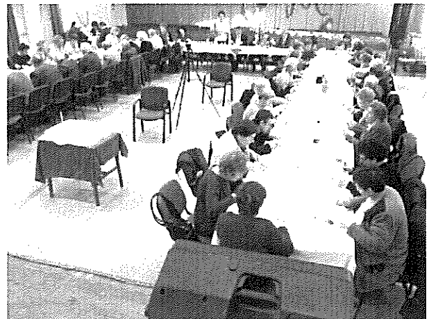
Az ünneplők egy csoportja

Gyertyagyújtással emlékeztünk meg a 15 év alatt elhunyt társainkról. Polgármester úr köszöntötte a klub tagjait és egy hatalmas, gyönyörű kerámiatálat ajándékozott az évforduló tiszteletére a klubnak. Összefoglaltuk az elmúlt évek emlékeit, eseményekben gazdag programjait.