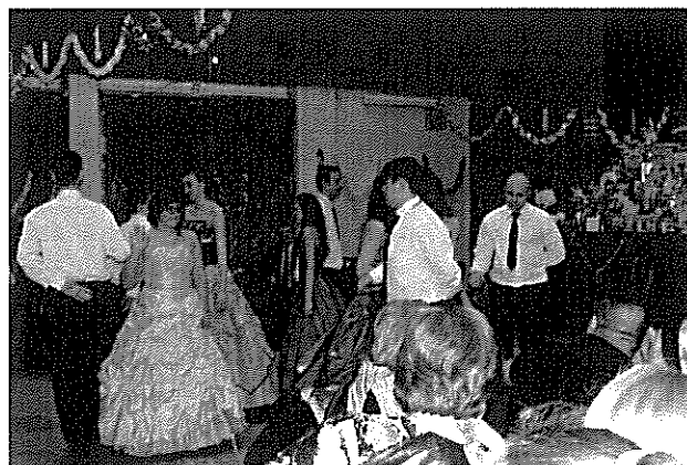
A jótekonysági bál fellépőinek egy csoportja