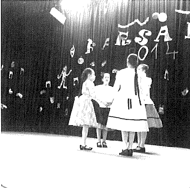
A „Kenderike” Néptáncsoport

Ugyancsak sok meghívással dicsekedhetünk, ahová a klub Nótakörét meghívják. Igyekszünk hasznosítani, amit tanultunk az „Idősek Akadémiáján” a „Kattints rá, Nagyi!” vagy a „Netrekész” tanfolyamon. Igyekszünk vállalt feladatainkat mindenkor becsülettel teljesíteni a község meglegedésére. Ezt a meglegedést és köszönetet éreztük Polgármester Úr köszöntőjéből, majd zárásként a Művelődési Ház ajándékműsorából. Nagy meglepetés ért bennünket, hiszen a Kenderike kis csapata és az Egyházasdengelegi „Táncoló Talpak” táncsoportja műsorral kedveskedett a jubiláló klub tagjainak.