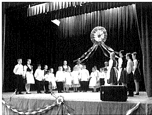
A Kenderike Néptáncsoport műsora