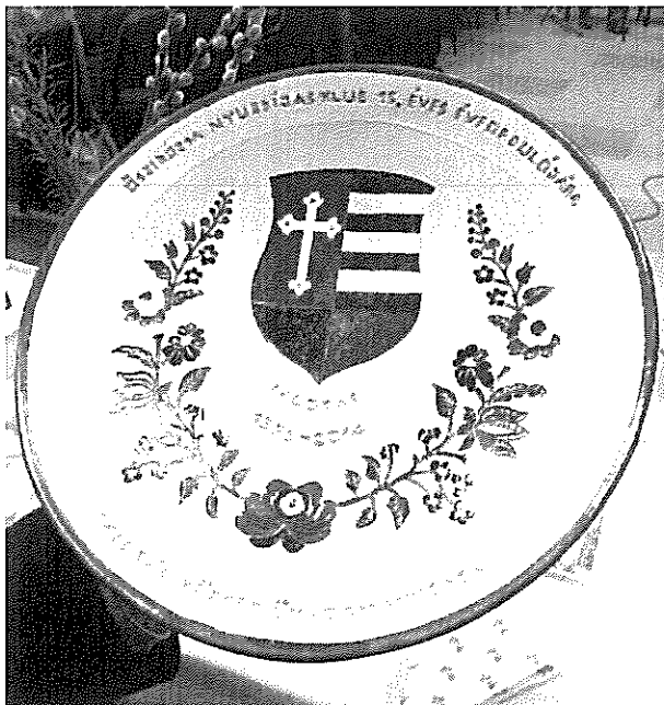
Az ajándék kerámia tál

Állandó programjaink: minden hónap harmadik szerdáján klubfoglalkozást tartunk, amikor előadásokat, tájékoztatókat hallgatunk meg időszerű, a szépkorúakat érdeklő kérdésekről és előkészítjük rendezvényeinket.