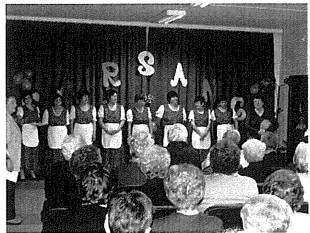
A Nyugdíjas Klub farsangi műsorán fellépők egy csoportja