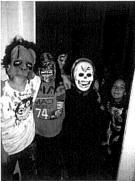
Halloween jelmezesek egy csoportja

2013. október. 25-én megrendezésre került iskolánk első Halloween bulija, a diákönkormányzat tagjai szervezésével. Ezen a délutánon a gyerekek ijeszítőbbnél-ijeszítőbb jelmezekbe öltöztek be és csapatonként mérték össze ügyességüket, különböző vetélkedőkben. Mindezek után érkezett a diszkó, ahol mindenki jól érezte magát. A DÖK tagjai egy rémisztő táncsal is meglepték a nagydémüt.