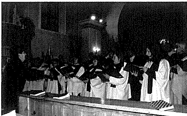
A Cantus Corvinus kórus adventi hangversenye

December 22-én nem mindennapi élményben volt részünk, a gyöngyösi Cantus Corvinus adventi hangversenye által, a Palotás Ifjúságáért Alapítványnak köszönhetően, a templomban. A meghitt hangulatot teremtő koncert méltó befejezése volt az óév programjainak.