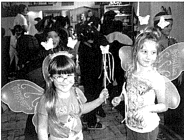
Óvodások a farsangi jelmezekben

Február 28-án – úgy tűnik – sikeresen elűztük a telet a fergeteges farsangi bálunkkal. Az idén a szülői munkaközösség tagjait is meghívtuk a mulatságra. A bálról készült fotók meglekintethők a facebookon.