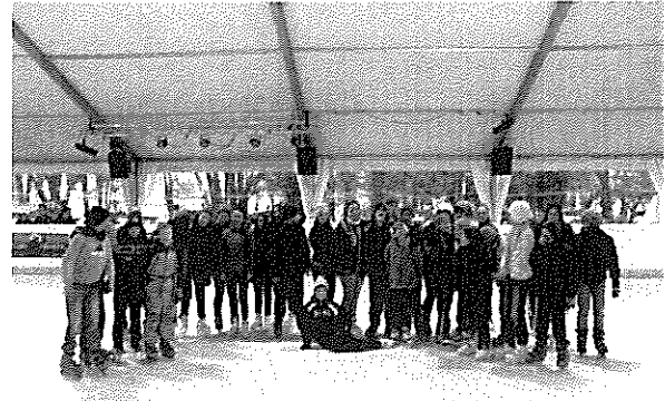
Korcsolyázók a hatvani műjégpályán

Január végén és február elején az iskola a hatvani műjégpályára járt korcsolyázni. Az osztályok 3 alkalommal élvezhették a csúszkálást. Sokat nevetve, játékosan tanultuk meg ezt az igen szórakoztató téli sportot.