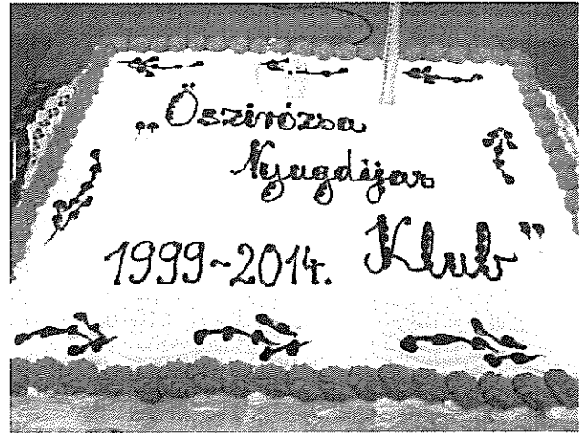
Az ünnepi torta

De ez még nem volt elég! A Művelődési Ház egy akkora hatalmas és finom tortát hozott ajándékba, mely a 80 fős ünneplő seregen kifogott.