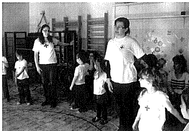
Az ifjú vöröskeresztesek az ovisokkal

Különös megtiszteltetés volt hallgatni a vendég óvónők visszajelzéseit, mi szerint a környékben egyedülálló a két szervezet együttműködése és szinte már irigykedve dicsérték a közös munkánkat! Büszkén fogadtuk a pozitív szavakat és örültünk, hogy megmutathattuk, mire vagyunk képesek együtt egy közös cél érdekében! A pozitív visszajelzések mellett kissé keserűen emlékeztünk meg arról, hogy korábban többen képviseltük szervezetünket a különböző programokon! Így kérjük, hogy aki kedvet kapott a cikk olvasása közben, hogy egy ilyen kicsi, de jól működő csapat tagjává váljon, az jelentkezzen bátran, várjuk sok-sok szeretettel!